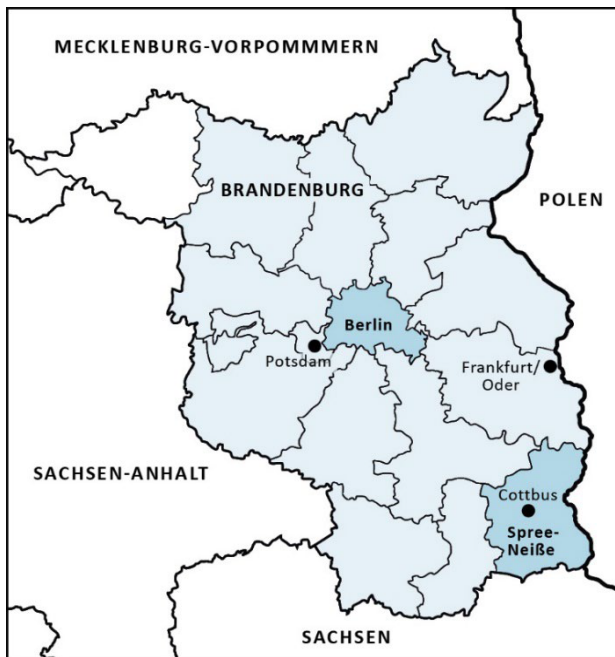
Abbildung 3: Die Projektregionen Berlin und Landkreis Spree-Neiße

Die Bundeshauptstadt Berlin und der Brandenburger Landkreis Spree-Neiße dienen als Beispiele für urbane Räume sowie für ländliche Regionen, in denen sich die Energiewende vollzieht. Während der Landkreis Spree-Neiße einen hohen Anteil an Einwohner*innen über 65 Jahren (28,5 %) aufweist, hat Berlin eine vergleichsweise junge Bevölkerung (19,2 %) (BMI 2019). Die Berliner Bevölkerung wächst stetig (+8,1 % 2005-2019), die Bevölkerung von Spree-Neiße schrumpft hingegen seit der Wende (-23,3 % 1990-2015) (Ganal et al. 2021: 42; LBV 2018). So steht Berlin vor der besonderen Herausforderung des Wohnraummangels, der Landkreis muss sich den Herausforderungen einer schrumpfenden und alternden Bevölkerung stellen.