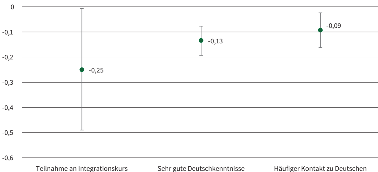
Ausgebildete Geflüchtete nach Besuch eines Integrationskurses weniger häufig nicht oder unterwertig beschäftigt

Anmerkung: Die Abbildung zeigt die marginalen Effekte der Variablen, die in der Regression einen statistisch signifikanten Effekt haben (mindestens auf dem 10%-Niveau). Diese sind die marginalen Effekte von sehr guten Deutschkenntnissen, Besuch eines Integrationskurses und häufiger Kontakt zu Deutschen auf die Wahrscheinlichkeit, trotz Ausbildung nicht oder unter dem Ausbildungsniveau beschäftigt zu sein. Geschätzt wurde ein Logit-Modell mit robusten Standardfehlern basierend auf Daten einer Befragung von 850 Geflüchteten aus dem Jahr 2019. In der Schätzung wurde zudem kontrolliert für Alter, Geschlecht, Arbeitserfahrung im Herkunftsland, Gesundheitszustand, das Jahr des Zuzugs nach Deutschland, den aufenthaltsrechtlichen Status und einem Ost-West Dummy.