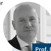
Prof. Dr. Oliver Falck

Bis zur Einführung des Gesetzes zur steuerlichen Förderung von Forschung und Entwicklung (kurz: Forschungszulagengesetz, FZulG) zum 1. Januar 2020 gab es in Deutschland keine steuerliche Förderung von privatwirtschaftlicher FuE. Bis zu diesem Stichtag hat sich der Staat neben dem allgemeinen Patentschutz auf die Förderung ausgewählter FuE-Projekte beschränkt. Mit der Einführung des Forschungszulagengesetzes wird das deutsche Förderinstrumentarium um eine steuerpolitische Förderung von FuE ergänzt. Diese steuerliche Förderung steht allen Unternehmen zur Verfügung, die ihren Sitz in Deutschland haben, hier steuerpflichtig sind und FuE betreiben. Die Förderung erfolgt