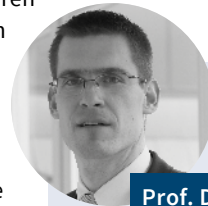
Prof. Dr. Niklas Potrafke

Im Beobachtungszeitraum 1960–2014 halten sich Steuererhöhungen und -senkungen im Mittel die Waage: Der Mittelwert des aggregierten Steuersatzreformindex beträgt – 0,01 (Standardabweichung: 0,329), der Mittelwert des aggregierten Steuerbemessungs-Grundlagenreformindex beträgt – 0,068 (Standardabweichung: 0,334). Fraglich ist allerdings, ob die Steuererhöhungen und -senkungen durch Wahlzyklen beeinflusst, sie also vor Wahlen eher gesenkt und nach Wahlen eher erhöht wurden. Erste Anhaltspunkte für solche Muster liefern Mittelwertvergleiche der Steuerreformindizes in Wahljahren mit anderen Jahren bzw. Vorwahljahren mit anderen Jahren und ebenso Nachwahljahren mit anderen Jahren.