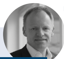
Prof. Dr. Dr. h. c. Clemens Fuest

Die Corona-Pandemie hat Stärken und Schwächen vieler Organisationen und Institutionen offengelegt. Das gilt auch für die Europäische Union. Pandemien sind ein Musterbeispiel für Krisen, die nicht an Grenzen halt machen. Daher besteht erheblicher Bedarf an Koordinierung und grenzüberschreitender politischer, wirtschaftlicher und medizinischer Zusammenarbeit. In Europa sollte der EU dabei eine zentrale Rolle zukommen. Vor allem in der frühen Phase der Pandemie hat sich gezeigt, dass die EU nicht darauf vorbereitet war, diese Rolle zu spielen.