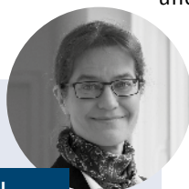
Prof. Dr. Karen Pittel

Die deutsche Politik steht nach der im Juni 2021 verabschiedeten Reform des Bundesklimaschutzgesetzes vor der Herausforderung, Anpassungen der energie- und klimapolitischen Maßnahmen vorzunehmen, um den neuen Vorgaben und Zielen Genüge zu tun. Da die Vorgaben des deutschen Klimaschutzprogramms schon nicht ausreichen, um die bisherigen Klimaziele für 2030 zu erreichen (UBA 2020), muss dies notwendigerweise mit einer Stärkung der klimapolitischen Signale einhergehen. Gleichzeitig sind zukünftige Finanzierungsspielräume für finanzielle Förderung aufgrund der Corona-Pandemie enger geworden. Sollen die mit-