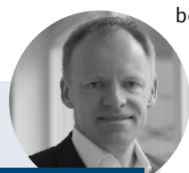
Prof. Dr. Dr. h. c. Clemens Fuest

ist Präsident des ifo Instituts und Professor für Volkswirtschaftslehre, Seminar für Nationalökonomie und Finanzwissenschaft, an der Ludwig-Maximilians-Universität München.