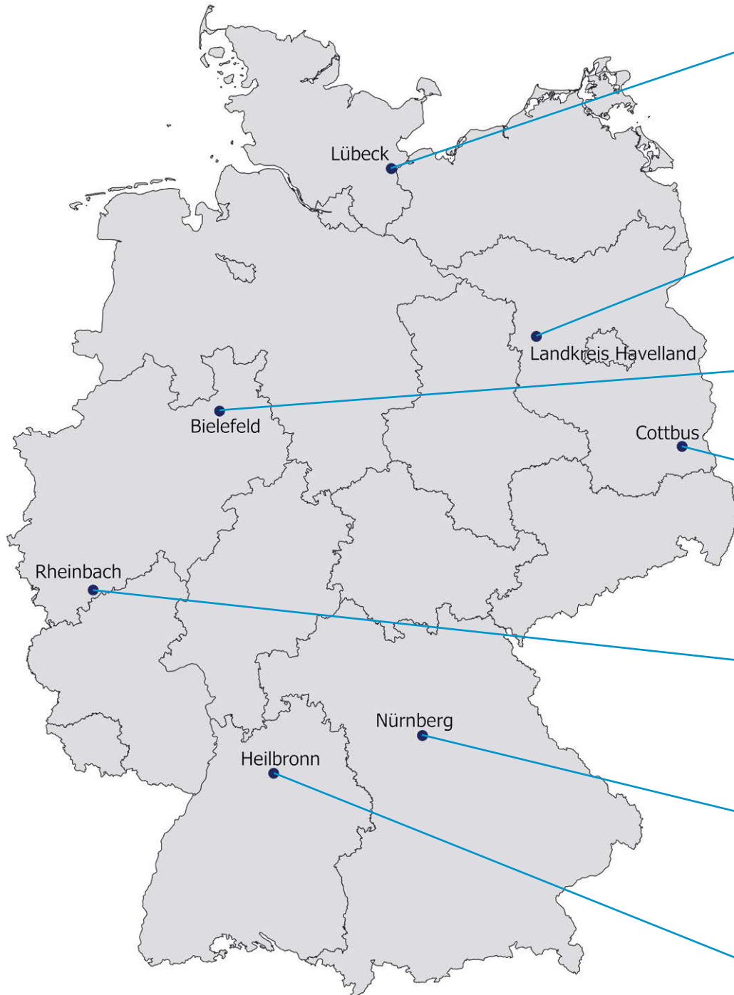
Abbildung 1: Übersicht der ausgewählten Fallbeispiele, eigene Darstellung

Für eine erfolgreiche Einbindung von Akteuren des Sports in die Stadtentwicklung spielen unterschiedliche Partner eine wichtige Rolle. Entsprechend breit ist das Spektrum der beteiligten kooperativen Akteure . Die ausgewählten Fallbeispiele geben vertiefte Einblicke, wie unterschied-