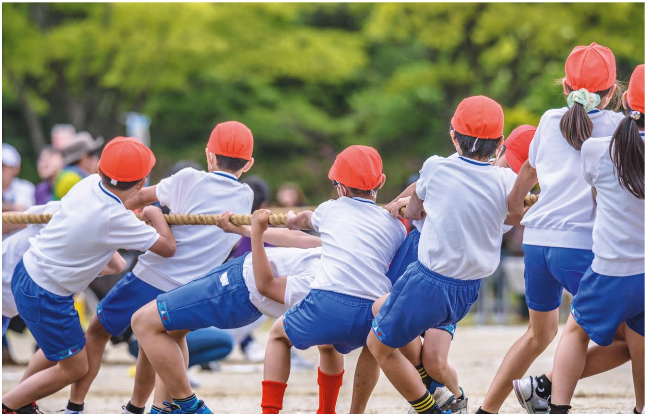
Abbildung 2: Kinder beim Tauziehen

und Mitarbeitern besetzten Verwaltungsressorts getragen. Die entsprechend abgeleiteten Handlungsempfehlungen für Kommunen unterteilen sich in der Folge in mehrere thematische Cluster (siehe 5.1). Es folgen Handlungsempfehlungen für Verbände (5.2), Vereine (5.3), den selbstorganisierten Sport (5.4) sowie abschließend zusammenfassende akteursübergreifende Handlungsempfehlungen (5.5).