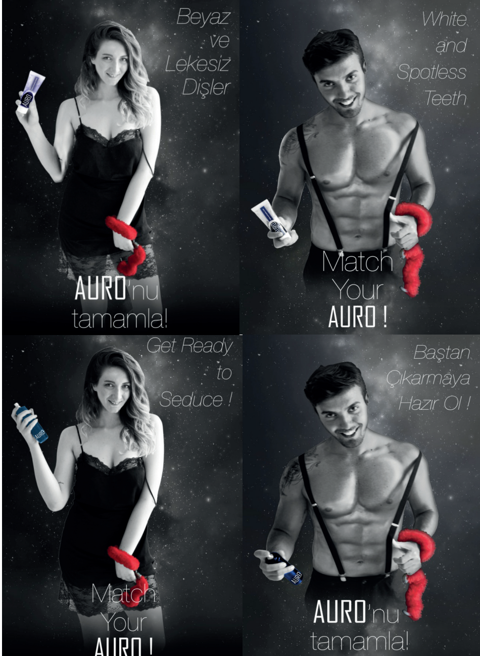
Ek- 1: Çalışmada kullanılan kurgusal reklamlar (Türkçe ve İngilizce)