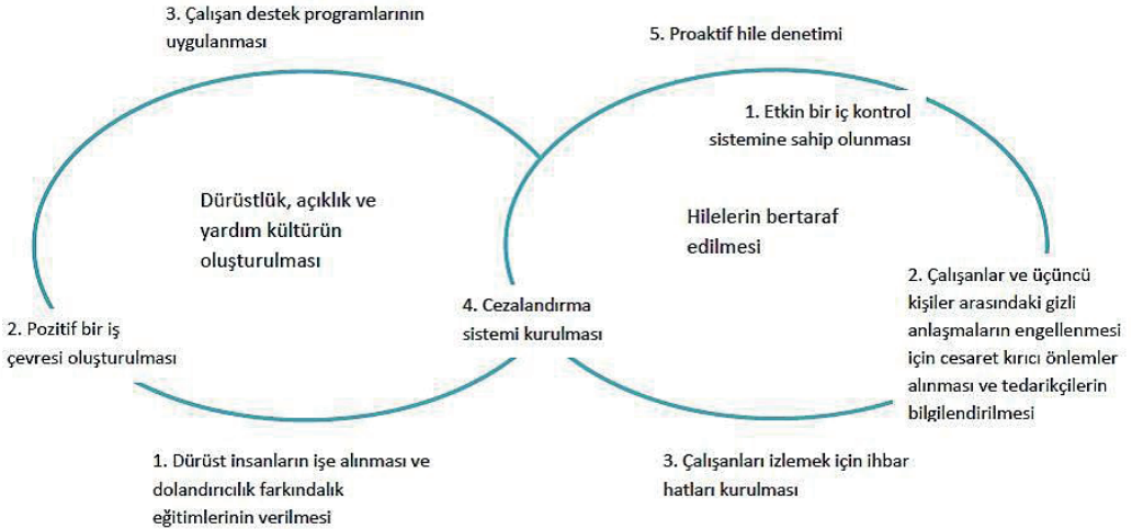
Şekil 1. Hile Önleme Modeli

İç kontrol sistemi, kurum bünyesindeki faaliyetlerin zamanında, doğru ve eksiksiz yürütülmesini sağladığı gibi, işletmeye olan güven ve itibarı da artırır (Hatunoğlu vd., 2012: 186). İç kontrol, bir kurumun yönetim kurulu, yöneticileri ve diğer çalışanları tarafından etkilenen ve faaliyetler, raporlama ve mevzuata uyumla ilgili amaçların gerçekleştirilmesine dönük makul bir güvence sağlamak amacıyla tasarlanan bir süreçtir. İç kontrol sisteminin, kontrol çevresi, risk değerlendirme, kontrol faaliyetleri, bilgi ve iletişim ile izleme başlığı altında beş temel bileşeni bulunmaktadır (COSO, 2013: 4-5). Hile önleyici kontrollerin bu beş temel bileşeni içermesi gerekmektedir birlikte bunların arasında kontrol çevresi özel bir yer teşkil etmektedir (Golden vd., 2006: 162). Kontrol çevresi, dürüstlük, ahlak değerleri, işletme çalışanlarının yetkinliği, yönetim felsefesi ve çalışma tarzı gibi manevi hususlarla birlikte yönetimin yetki ve sorumluluk verme şekli ile işletme çalışanlarının organizasyonu ve gelişimi gibi daha