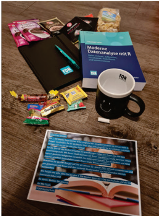
Abbildung 1: Inhalte der 1. RNI-Boxen der FOM Hochschule und der FH Joanneum