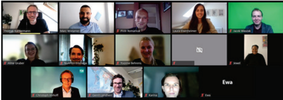
Abbildung 8: Teilnehmende der 2. RNI Master Days am 31. August 2021