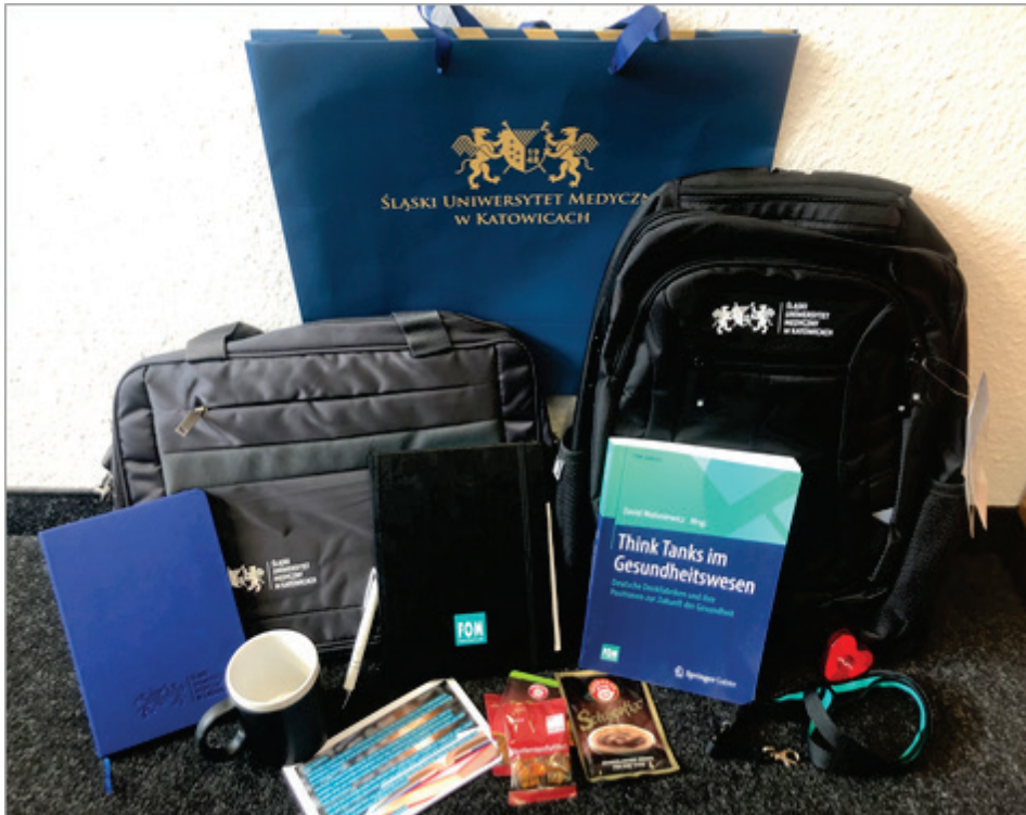
Abbildung 6: Inhalte der 2. RNI Boxen der FOM Hochschule und der SUM

Wie bereits bei den 1. RNI Master Days bekamen die Teilnehmerinnen und Teilnehmer eine RNI-Box geschickt, welche landesspezifische Leckereien und Werbematerialien beider Hochschulen beinhaltetete.