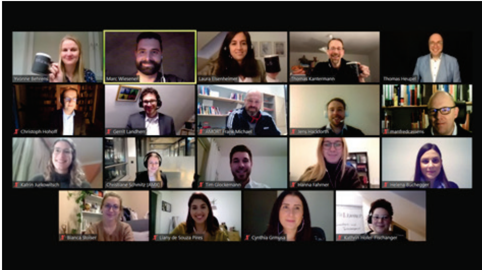
Abbildung 3: Teilnehmende der 1. RNI Master Days am 12. Januar 2021