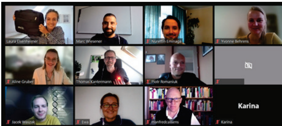
Abbildung 9: Teilnehmende der 2. RNI Master Days am 02. September 2021