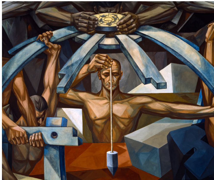
Udsnit af vægmaleriet Mankind's Struggle for Lasting Peace . Maleriet, der er tyve meter langt, hænger på tredje sal i konferencebygningen i FN-bygningen i New York. Værket er udført af José Vela-Zanetti fra Spanien, og FN fik det som gave af John Simon Guggenheim Memorial Foundation i 1953.