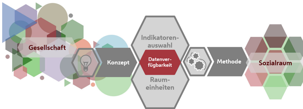
Abbildung 1 Kernelemente einer quantitativen Sozialraumanalyse