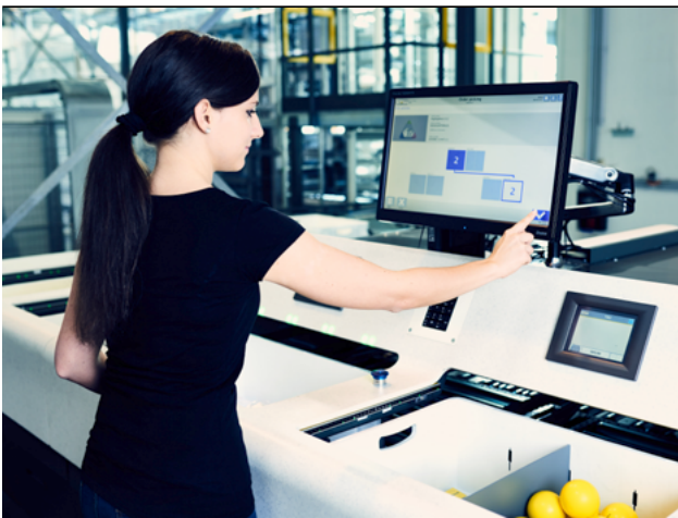
Abbildung 3: Smart Worker Workstation

ter wie unser Open Shuttle 6 oder kleine autonome Roboter, die in den Regalen fahren, wie das OSR ShuttleTM. 7 Durch sie wird die Ware zur richtigen Zeit am richtigen Ort zu ergonomisch designten »Ware-zur-Person«-Arbeitsplätzen gebracht. Die Artikel, die Sie bestellt haben, egal ob Sie Filialleiterin oder Endkundin sind, werden der Reihe nach automatisiert aus den Lagerbeständen geholt und dem Arbeitsplatz angedient 8 und vom Lagerarbeiter in einen Karton, der bereits adressiert ist, gegeben. Dadurch entfallen die Gehwege von einem Regalfach zum anderen. Wichtig ist auch, dass dadurch die Menschen entlastet werden, denn Regale sind ja nicht für den Menschen gebaut worden, sondern für die Ware. Bei den Arbeitsplätzen nach dem Prinzip »Ware-zur-Person« hingegen, können die Arbeitsplätze so gestaltet werden, dass sie für die Mitarbeiter ideal sind.