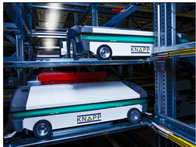
Abbildung 2: OSR-Shuttle

ten, kundenspezifische Detailausführungen zu konfigurieren. Dementsprechend müssen die richtigen Teile »just-in-time« an der richtigen Stelle sein, damit das Auto auch entsprechend dem Kundenwunsch zusammengestellt werden kann. Heute geht es also weniger um die Masse, sondern um die berühmte Losgröße 1. 2 In vielen Branchen zeichnet sich eine Entwicklung hin zu immer kleiner werdenden Losgrößen ab, vom E-Commerce-Business bis hin zu Branchen, die customized Produkte produzieren. Auch hier setzen wir mit unseren Lösungen an, denn die Logistik muss heute mehr denn je über die gesamte Supply-Chain beziehungsweise Value-Chain reibungslos funktionieren. Über die Distribution aus großen Verteilzentren in die Städte bis in den regionalen Raum, wo Produkte entsprechend den Kundenwünschen, also flexibel, immer verfügbar, verteilt werden, zum Beispiel bei kleinen Greißlern. 3