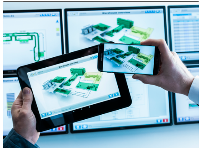
Abbildung 4: KiSoft Analytics

Roman Schnabl: Das ist ganz unterschiedlich. Sehr viele Entscheidungen können schon im Vorfeld auf der Grundlage von intelligenten Berechnungen getroffen werden. Zum Beispiel kann nach Bestimmung des Versandvolumens schon der richtige Karton angedient werden. Aber der Mensch ist nach wie vor das flexibelste Element. Und so entscheidet der Mensch an der Workstation des »Ware-zur-Person«-Systems zum Beispiel über die Qualität der Ware, die ausgeliefert wird, indem er sie ansieht und angreift. Wenn die Ware nicht der Qualität entspricht, dann wird die Ware aufgrund der Entscheidung des Menschen aus dem System entnommen und stattdessen ein anderes Stück ausgewählt. Es sind vor allem die flexiblen Tätigkeiten, bei denen der Mensch nach wie vor das beste Bildverarbeitungssystem der Welt hat, nämlich seine Augen, und auch die beste Greifeinheit, nämlich die menschliche Hand. Und es ist nach wie vor der Mensch, der am besten entscheiden kann, ob die Qualität für den Endkunden stimmt.