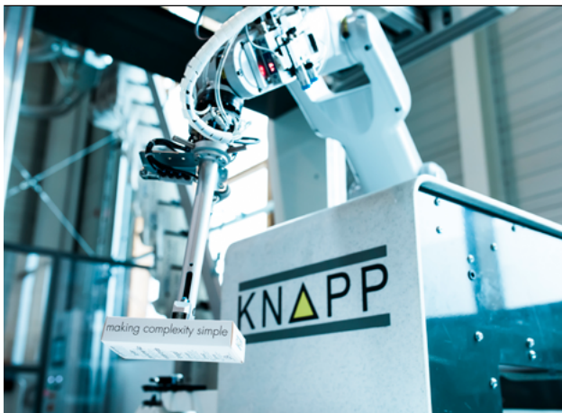
Abbildung 5: Robotic

ren. In Wahrheit hat es aber nicht so effizient funktioniert wie gewünscht. Wir haben gesehen, dass der Mensch den Artikel einfach viel besser greifen kann, wohingegen eine Maschine in ihrer Flexibilität limitiert ist. Wenn ein Unternehmen rund einhundert unterschiedliche Artikel hatte, konnte die Maschine zwar jeden erlernen und die Artikel auch einigermaßen ordentlich schlichten. Praxistauglich war das aber noch lange nicht. Als Beispiel: Ein typischer österreichischer Pharmagroßhändler hat rund vierzigtausend unterschiedliche Artikel im Sortiment. Wenn die Maschine also nur ein paar hundert am Tag verarbeiten kann, dann ist das wie ein Tropfen auf dem heißen Stein. Die Anforderungen des Marktes hat unser System nicht geschafft, nicht mit dem Algorithmus und auch nicht mit der Technik. Es war einfach zu komplex und keine Erfolgsgeschichte. Wir hatten damals noch nicht die Rechenkapazität und eigentlich den falschen Ansatz. Aber wir sind der Idee treu geblieben, haben daran weitergearbeitet und uns sehr früh mit Künstlicher Intelligenz und mit Maschinellern beschäftigt. Heute sind wir soweit, weltweit einige der wenigen zu sein, die das im Griff haben. Und so platzieren wir den Roboter mittlerweile erfolgreich bei unseren Kunden.