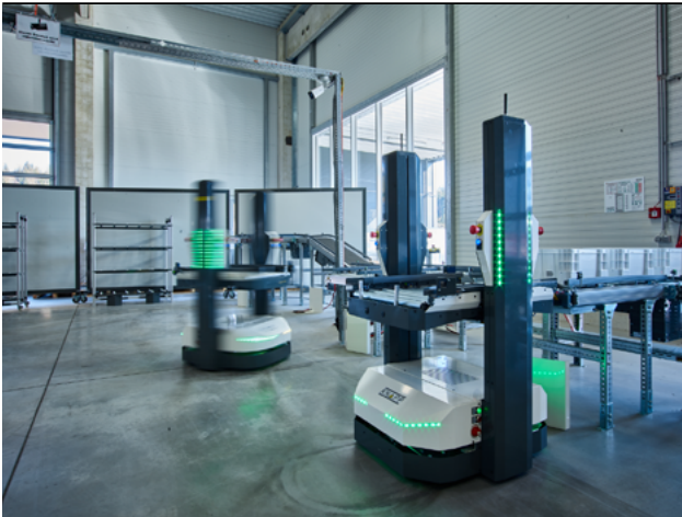
Abbildung 1: Open Shuttle

gar nicht mehr aufrechterhalten werden könnten. Und deshalb bauen unsere Systeme nicht darauf auf, Jobs zu ersetzen, sondern setzen darauf, da zu helfen, wo es ohne digitale und automatisierte Systeme nicht mehr geht. Da, wo es sinnvoll ist, dem Menschen unter die Arme zu greifen. Es geht um Automatisierung nach Maß, denn das ist auch wirtschaftlich betrachtet immer am sinnvollsten.