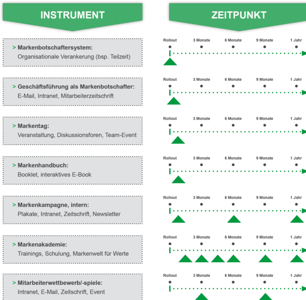
Abbildung 3: Optimierungsempfehlung zu Weiterführung des Integrationsgedankens