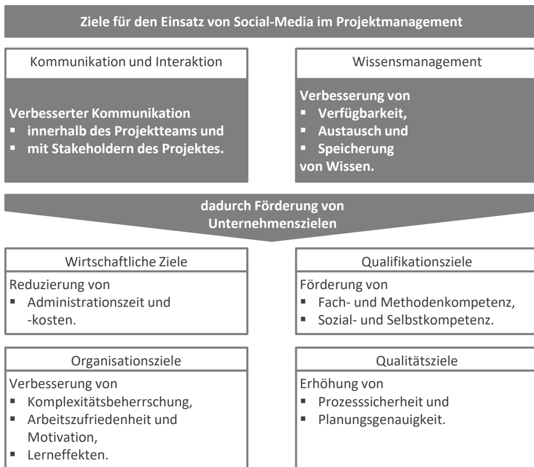
Abbildung 1: Ziele des Einsatzes von Social-Media im Projektmanagement

Bei einer Einführung von Social-Media im Projektmanagement stehen zwei wesentliche Ziele im Mittelpunkt. Wie Abbildung 1 zeigt, sind dies einerseits eine Verbesserung der Kommunikation und Interaktion und andererseits eine Verbesserung des Wissensmanagements. In der Abbildung wird zudem deutlich, dass mit dem Erreichen dieser Ziele weitere Verbesserungen auch in verschiedenen anderen Unternehmensbereichen erreicht werden können. 5