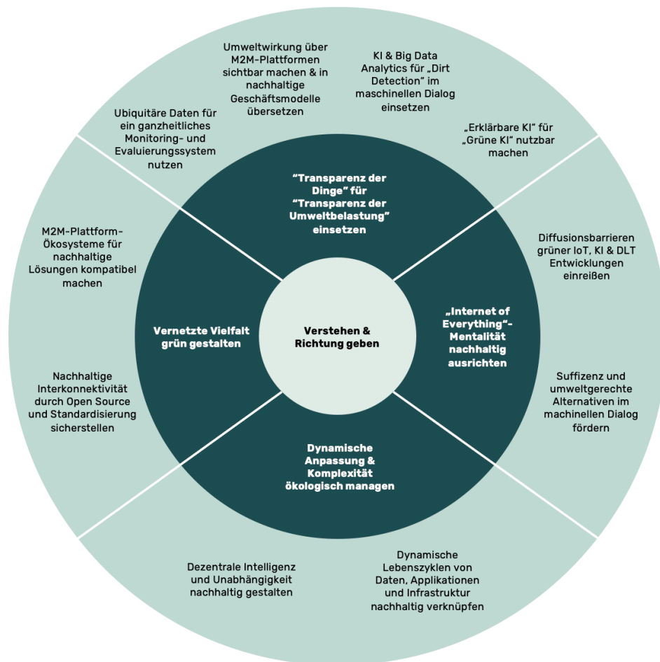
Abbildung 2: Herausforderungen an ein grünes Zusammenspiel der Technologien (eigene Darstellung)

Um ein grünes Zusammenspiel von Technologien in der Machine Economy zu etablieren, müssen wir uns den folgenden Herausforderungen und Wissenslücken stellen.