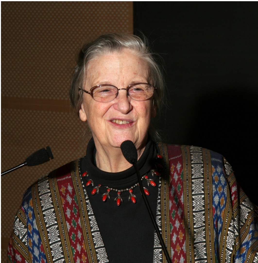
Elinor Ostrom at the award ceremony for the degree of Doctor Honoris Causa at the Norwegian University of Science and Technology.