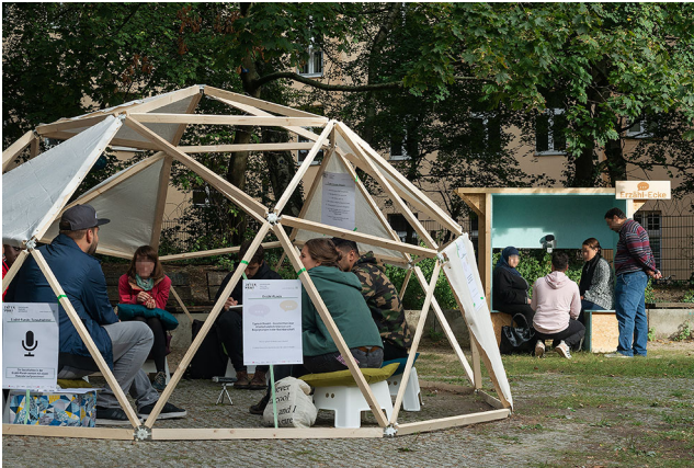
Abbildung 1 Die Erzählrunde (Vordergrund) und die Erzählecke (Hintergrund) während der Vor-Ort-Intervention in Berlin-Moabit, auf dem Platz an der Ecke Salzwedeler Straße/Quitowstraße