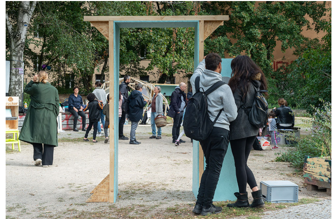
Abbildung 2 Eingang zum temporären Interventionsraum der Vor-Ort-Intervention in Berlin-Moabit