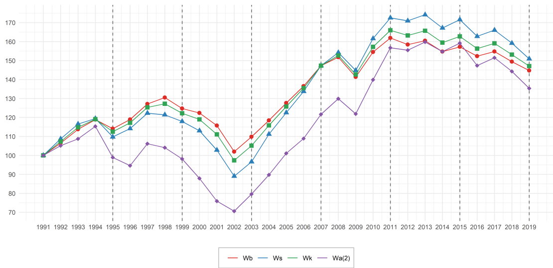
Figura 3: W_b , W_s , W_k y W_{a(2)} anuales (1991-2019)