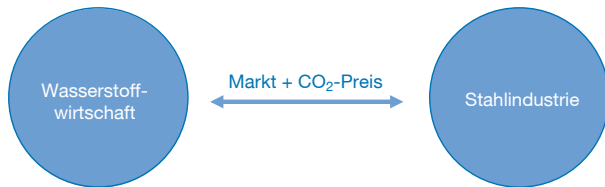
Abbildung 1 Traditionelle Klimapolitik