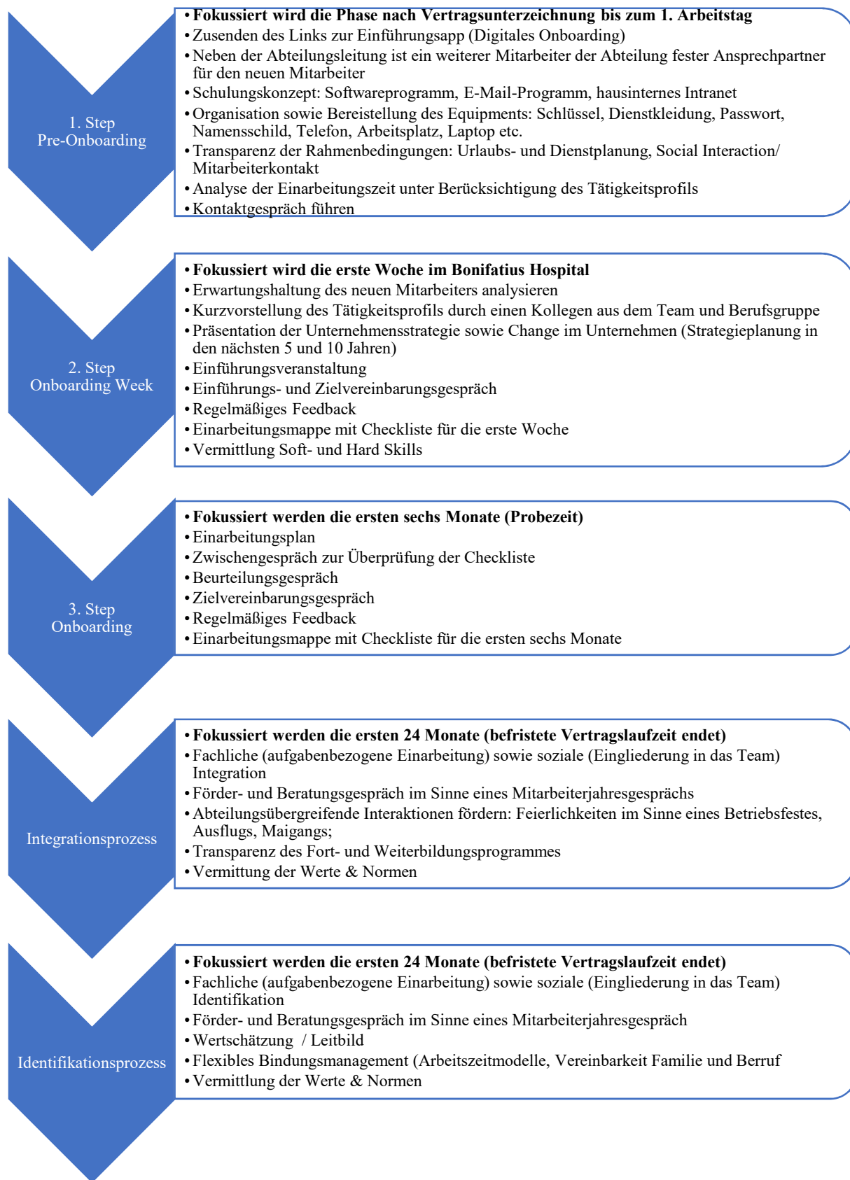
Abbildung 4: Reorganisation des Onboarding Prozesses im Bonifatius Hospital Lingen