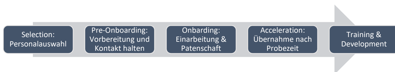
Abbildung 3: Onboardingprozess

Der Boston Consulting Group (BCG) zur Folge, sind die beiden Personalthemen Onboarding und Bindung der Generation Y auf Platz zwei, die Einfluss auf Marge und Umsatz von Unternehmen haben. Organisationen, die besonders erfolgreich bei der Bindung neuer Mitarbeiter sowie beim Onboarding sind, ist die Marge 1,9-fach und der Umsatz 2,5-mal höher als bei Unternehmen, die kein Onboarding und wenig ausgeprägte Mitarbeiterbindung verzeichnen. 31 Grundsätzlich müssen die in Abbildung 3 dargestellten Schritte im Onboarding-Prozess beachtet werden. 32