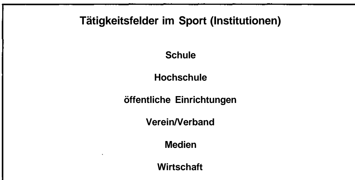
Abb. 1: Tätigkeitsfelder im Sport (Institutionen)

Aufgrund dieser schlechten Berufsperspektive orientieren sich immer mehr Studierende innerhalb ihres sportwissenschaftlichen Fachstudiums um Vorlesungen und Seminare, die Informationen, Kenntnisse und Fähigkeiten für Aufgaben und Tätigkeiten im außerschulischen Bereich vermitteln, erleben vielerorts einen enormen Zuspruch, der nicht immer ausreichend befriedigt werden kann. Für Lehrangebote dieser Art fehlt oft das qualifizierte Personal an den Instituten. Auch hier ergibt sich - wie sollte es anders sein - wieder ein „Verteilungskampf: Neue Studieninhalte konkurrieren mit altbewährten, in denen es sich so manche Kolleginnen und Kollegen „bequem“ gemacht und ihre Kapazitäten verplant haben. Hier ist ein Umdenken gefordert, um den Studierenden entsprechende Inhalte und Qualifikationen für außerschulische Tätigkeitsfelder (Abb. 1) zu vermitteln.