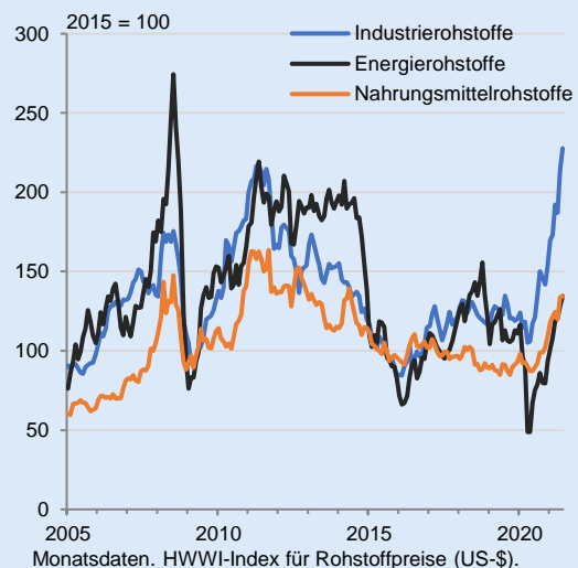
Abbildung 1: Rohstoffpreise