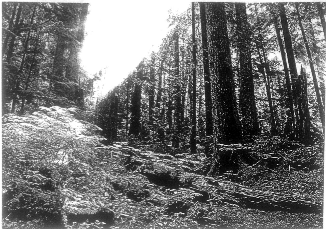
Regenwald; Schätzungen zufolge werden bis zu 30% der jährlichen CO 2 -Emissionen durch Brandrodungen in tropischen Wäldern verursacht. Ein Ansatzpunkt für eine Reduzierung der CO 2 -Emissionen weltweit ist daher der Schutz tropischer Wälder.