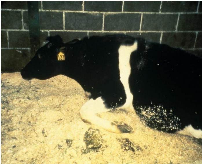
An BSE erkrankte Kuh.

schaft gewannen wieder die Oberhand. Der ökologische Landbau steht heute eher am Rande, jedenfalls nicht im Zentrum des politischen Diskurses - und von „Agrarkultur“ sind wir noch weit entfernt.