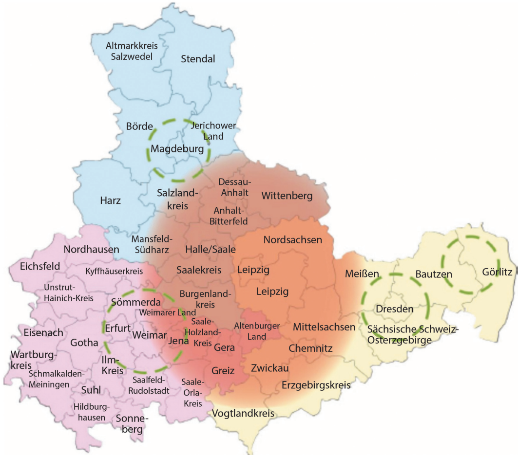
Abb. 2: Karte zu Szenario 1 – „Metropolregion Mitteldeutschland“ im Kernraum / Quelle: Eigene Darstellung, Grundlage: Bundesamt für Kartographie und Geodäsie: Verwaltungskarte Deutschland 2013

weil die Gebietskörperschaften mit ähnlichen Problemstellungen konfrontiert werden, zum anderen, weil zwischen den städtischen Zentren und ihrem Umland intensive Verflechtungen bestehen.