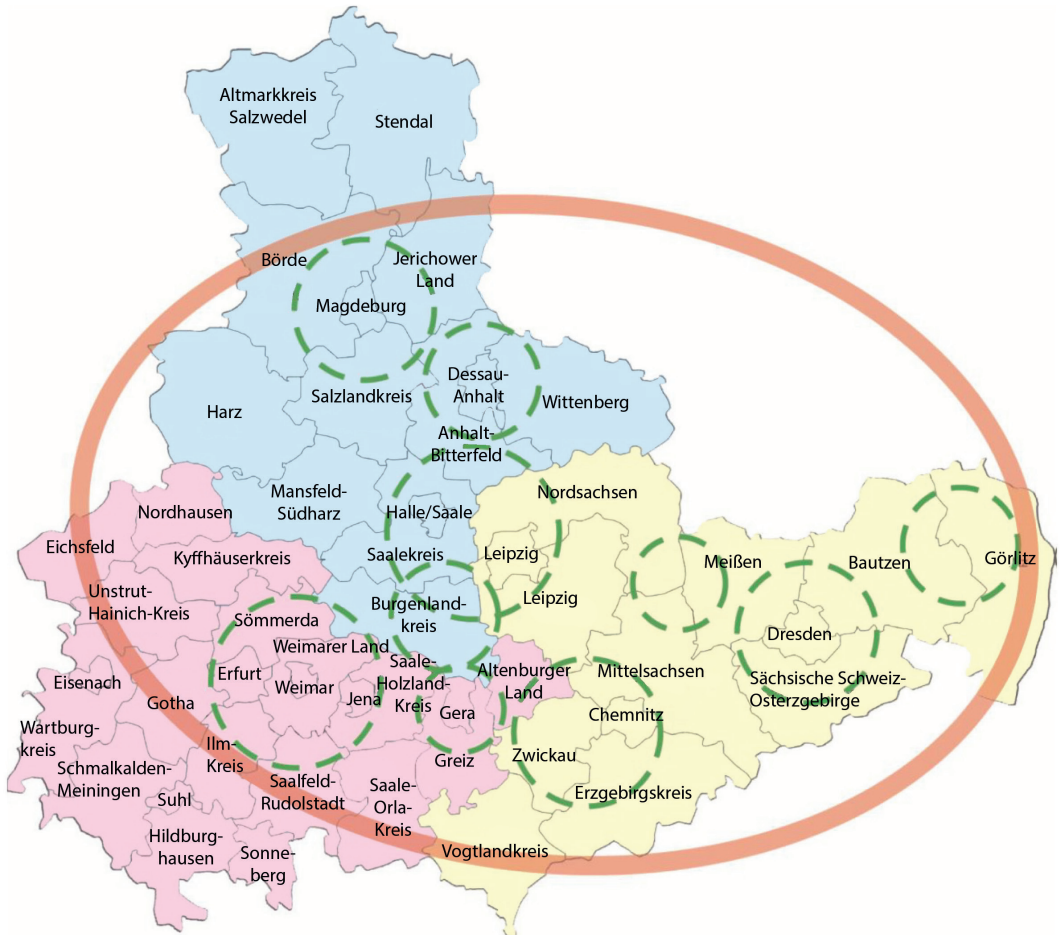
Abb. 3: Karte der „Metropolregion Mitteldeutschland“ als Partnerschaft der Stadtregionen

effizient und umfassend bearbeitet wurden. Dies ist nicht zuletzt dadurch begründet, dass die Stadtregionen erkannt haben, dass Problemlagen und Herausforderungen, denen Städte und ländliche Räume gegenüberstehen, nicht an Stadtgrenzen enden, sondern sowohl die Kernstädte als auch das Umland gleichermaßen betreffen und langfristig nur gemeinsam gelöst werden können.