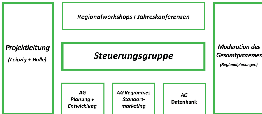
Abb. 6: Übersicht zu den Organisations- und Steuerungsstrukturen der interkommunalen Kooperation zur Gewerbeflächenentwicklung

Während des bisherigen Kooperationsverlaufes etablierten sich verschiedene Strukturen zur Organisation und Steuerung der Zusammenarbeit. Dazu zählen drei Arbeitsgruppen sowie eine Steuerungsgruppe. In regelmäßigen Abständen finden Regionalworkshops und Jahreskonferenzen in der Region statt.