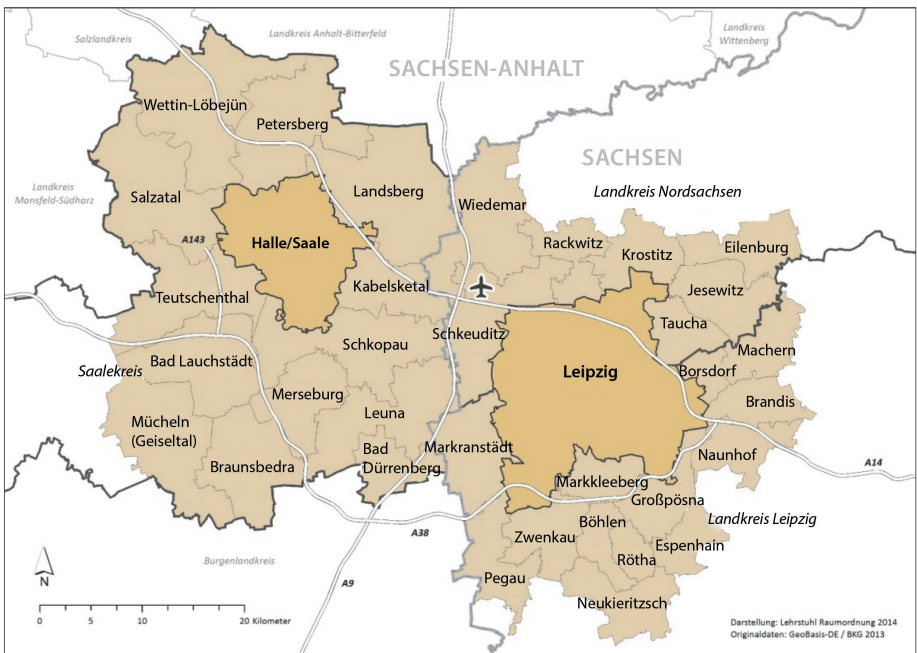
Abb. 5: Übersichtskarte: Kooperationsraum interkommunale Gewerbeflächenentwicklung Region Halle/Leipzig

Neben den beiden Oberzentren beteiligten sich an der Zusammenarbeit auch die kreisangehörigen Kommunen aus Sachsen-Anhalt und Sachsen, die sächsischen Landkreise Leipzig und Nordsachsen sowie der Landkreis Saalekreis in Sachsen-Anhalt. Weitere Beteiligte waren die oberen Landesplanungsbehörden aus jeweils beiden Bundesländern sowie die Regionale Planungsgemeinschaft (RPG) Halle und der Regionale Planungsverband (RPV) Leipzig-West Sachsen. Darüber hinaus nahmen neben den gebietskörperschaftlichen Akteuren auch die Industrie- und Handelskammern Halle-Dessau und Leipzig teil.