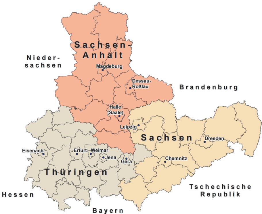
Abb. 1: Landkarte der drei mitteldeutschen Länder und ihrer Kernstädte