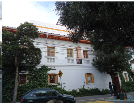
Fotografía 2 - Escuela INCINE