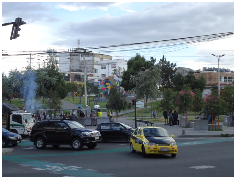
Fotografía 1 - Mercado de comida -