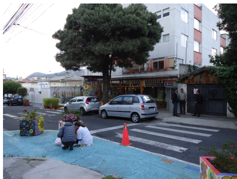
Fotografía 3 - Cine 8 y medio