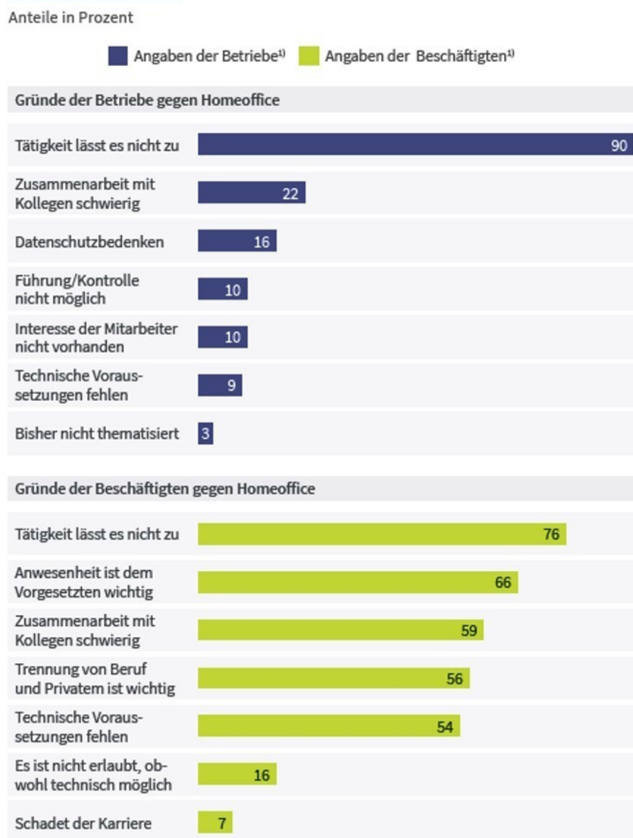
Abbildung 2 Gründe, die gegen Homeoffice sprechen

Anmerkung: 1) Anteil der Betriebe, die kein Homeoffice anbieten bzw. Anteil der Beschäftigten, die nie von zu Hause arbeiten, und diesen Bedenken gegen Arbeit von zu Hause zugestimmt haben.