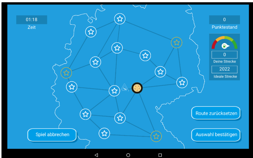
Abbildung 3: Spielkonzept zur Routenplanung

Dem Prototypstatus der App entsprechend, stießen Zusatzfeatures wie Logistik-tips als Pop-up Pakete auf der Übersichtskarte, bisher nur rudimentär als Textinhalte bei Übergangsbildschirmen vorhandene Story oder die generelle Darstellung der eigenen Position auf der Landkarte, sowie ein motivatorischer Überbau (Rahmenhandlung) bei einigen Teilnehmern auf Unverständnis. Ebenso wurde der Wunsch nach größerem Spielumfang sowie Hintergrundmusik geäußert.