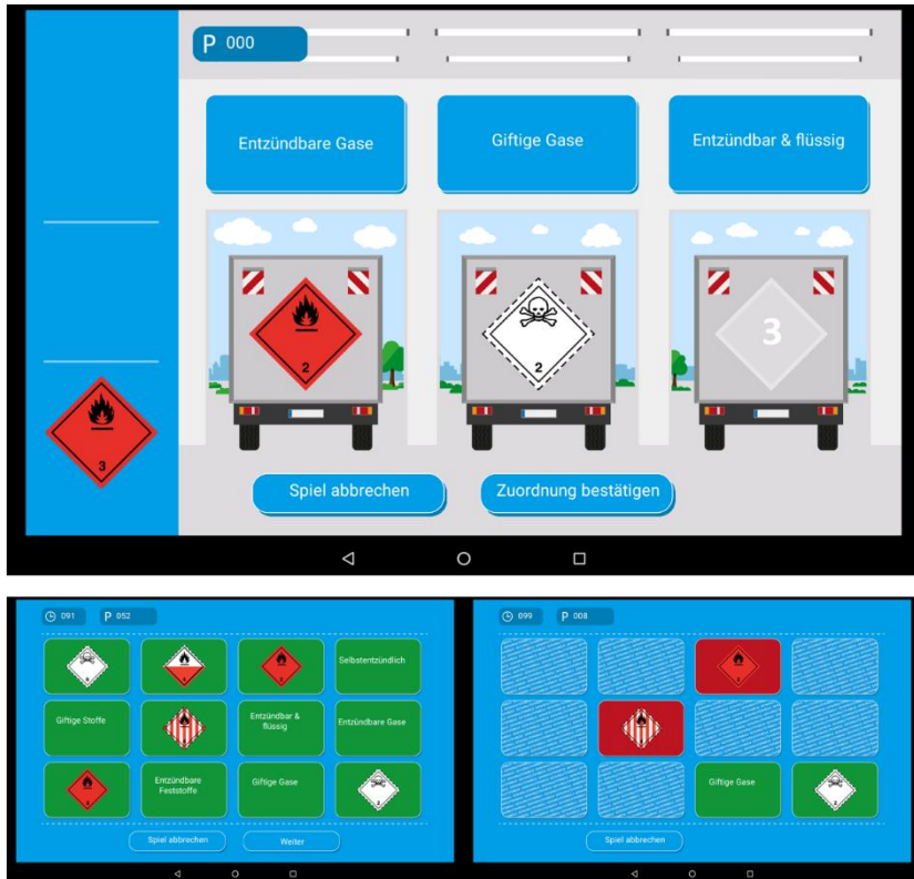
Abbildung 5: Gefahrgutspiele