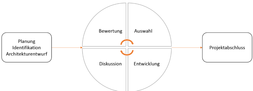
Abbildung 1: "Sprint"-Zyklus

14