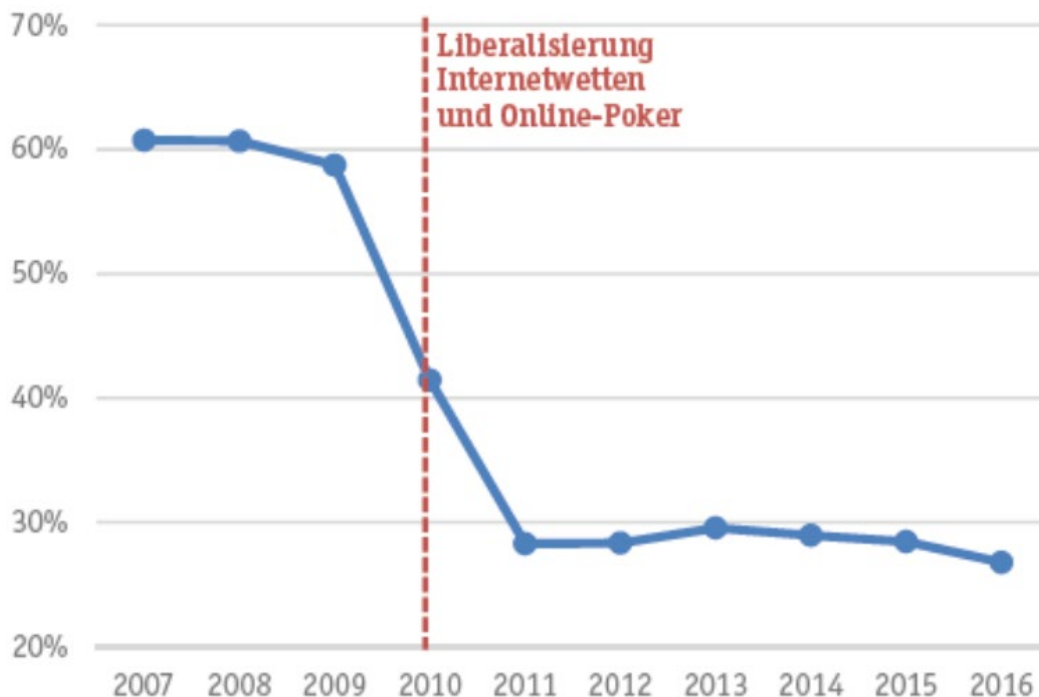
Abbildung 2: Entwicklung des Offshore-Anteils im französischen Online-Glücksspielmarkt von 2007-2016

Allerdings ist hierbei zu berücksichtigen, dass der in der Abbildung dargestellte Offshore-Anteil sich nur auf den sogenannten Graumarkt bezieht und den Schwarzmarkt nicht berücksichtigt. Copenhagen Economics (2016) beziffert die Kanalisierungsrate für das Jahr 2016 auf nur rund 50 Prozent.