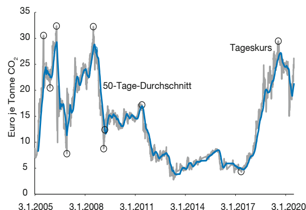
Abbildung 1 Schwankungen der CO 2 -Future-Preise