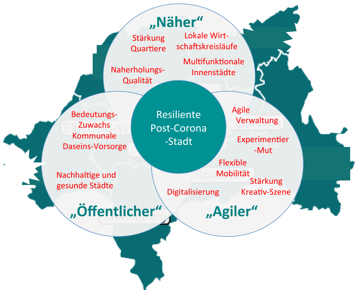
Abb. 1: Konturen einer resilienten Post-Corona-Stadt