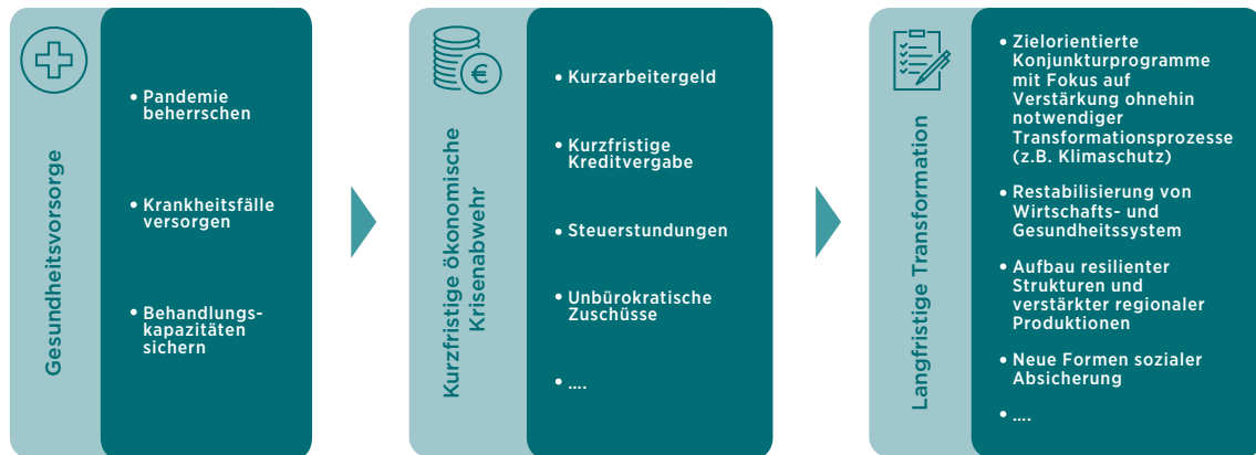
Abb. 2: Drei-Phasen-Modell des Umgangs mit der Corona-Krise

(1) In den kommenden Wochen steht ohne Zweifel zunächst und ganz primär die Gesundheitsvorsorge im Fokus. Es gilt eine globale Corona-Pandemie mit Hunderttausenden von Toten abzuwenden und die weitere Ausbreitung der Pandemie soweit wie eben möglich zu begrenzen. Deswegen haben die Maßnahmen des Gesundheitsschutzes aktuell eine so große Bedeutung.