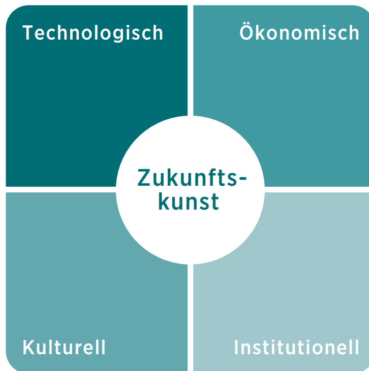
Abb. 1: Die vier Dimensionen der Zukunftskunst als Orientierungsraster für Zukunftsgestaltung in der Corona-Krise 1

Dabei darf eines nicht vergessen werden: Die Corona-Krise trifft Deutschland, Europa und die Welt zu einem Zeitpunkt, zu dem ohnehin eine Vielzahl an gewaltigen Herausforderungen zu lösen sind. Dies gilt für den richtigen Umgang mit den wachsenden Flüchtlingsströmen und die Beseitigung sozialer Ungleichheiten ebenso wie aus umweltpolitischer Sichtweise für die Bewältigung der Folgen des Klimawandels und die Eingrenzung weiterer Klimaveränderungen. Hinzu kommen Fragen wie die Gestaltung des Übergangs in das digitale Zeitalter und das Schließen von Stoffkreisläufen durch verstärkt zirkuläre Wirtschaftsformen – Beispiele für langfristige Trends, inmitten welcher sich alle (aktuell) befinden. In allen Bereichen sind massive Investitionen und ein proaktives Gestalten der damit verbundenen, zum Teil massiven strukturellen Veränderungen erforderlich.