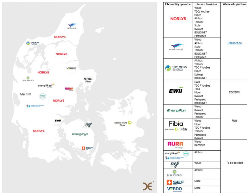
Abbildung 3-2: Wholesale-Plattformen für Glasfaservorleistungsprodukte in Dänemark

Die folgende Abbildung 3-2 zeigt, dass auf dem dänischen Markt trotz seiner vergleichsweise kleinen Größe von den alternativen Anbietern drei unterschiedliche Wholesale-Plattformen verwendet werden (Opennet, Fibia, TDC/EWII). Diensteanbieter können auf einer oder mehreren Plattformen aktiv sein. Auf den verschiedenen Plattformen werden jedoch keine einheitlichen Schnittstellen und Standards verwendet. Aus Sicht eines Incumbents erhöht dies die Transaktionskosten für Wholebuy, wenn Vereinbarungen mit mehreren Plattformen abgeschlossen und verschiedene Standards umgesetzt und gelebt werden müssen.