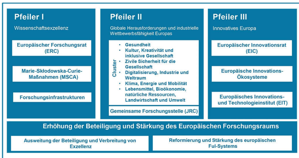
Abbildung 4-1: Vorläufige Struktur des 9. Forschungsrahmenprogramms Horizon Europe