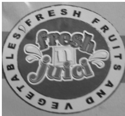
Abb. 8: „Fresh n Juici“ Label

gefordert. Im Februar 2009 führte Nakumatt als erster in Kenia agierender Supermarkt den Standard KenyaGAP ein, der konform zu GlobalGAP ist. Dafür kreierte der Supermarkt das Label „Fresh n Juici“ (siehe Abb.8).