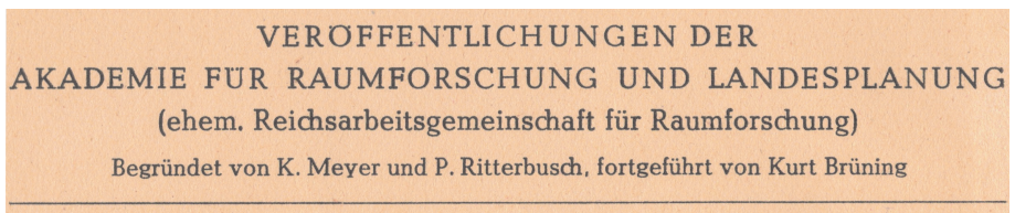
Abb. 2: Auszug aus der Titelei der Reihe „Raumforschung und Landesplanung. Abhandlungen“ 1950, Band 16 (Egner 1950: 2)

Die Akademie hatte also die Arbeit der Reichsarbeitsgemeinschaft mit hoher perso- neller und methodischer, wenn auch inhaltlich angepasster Kontinuität fortgesetzt. Dazu bekannte man sich offen, etwa in den Titeleien ihrer Publikationen (siehe Abb. 2).