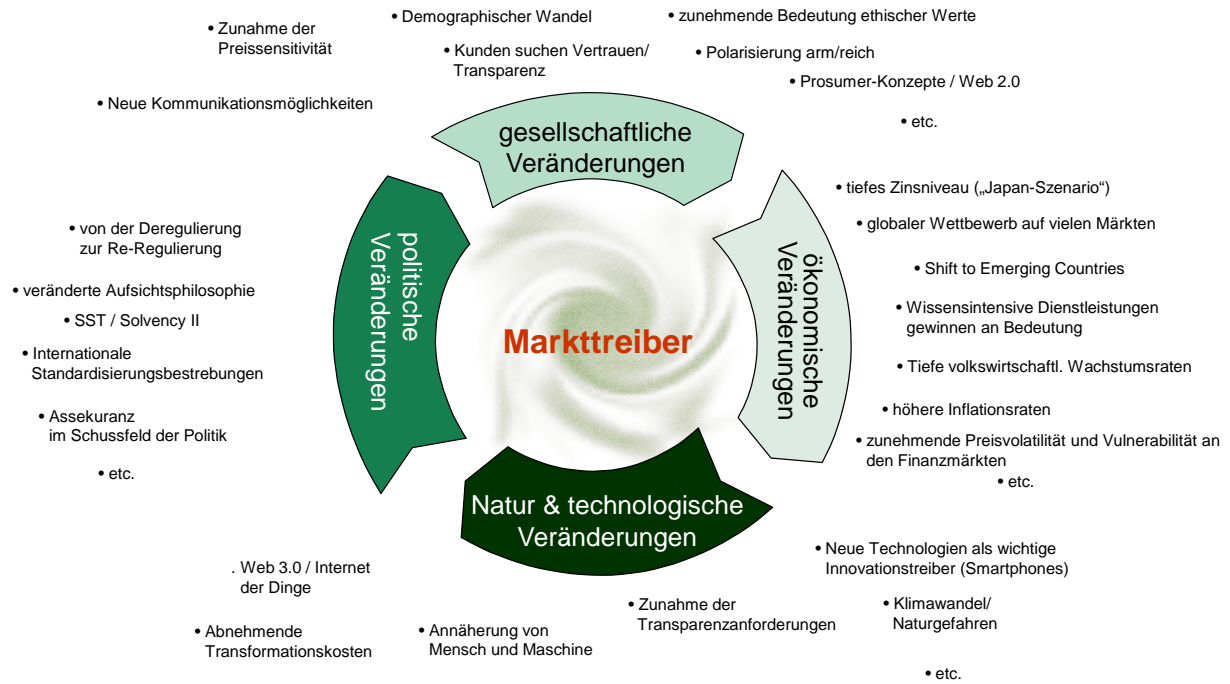
Abbildung 4: Umweltentwicklungen