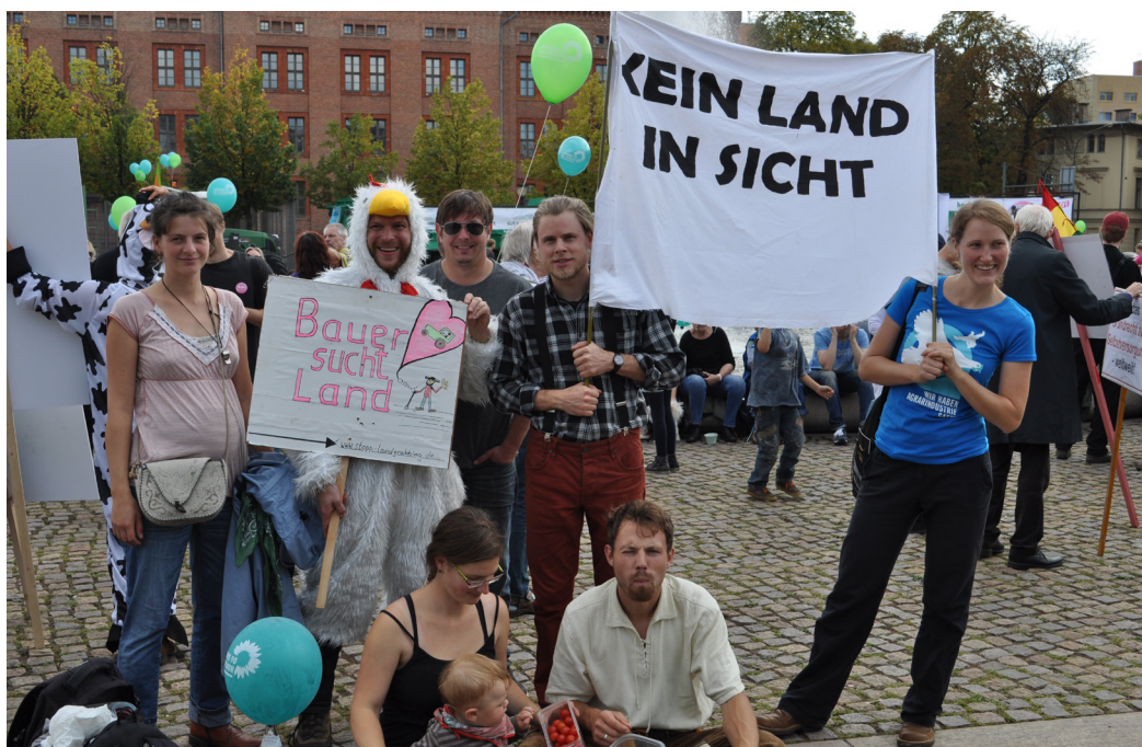
Demo „Wir haben es satt“, Potsdam, anlässlich der Brandenburger Landtagswahlen, 2014

Ebene sind der DBV bzw. die ostdeutschen LBVs eine zentrale Lobbygruppe. Gerade am Beispiel der EU-Agrarsubventionen zeigt sich deren Einfluss. Kaum eine andere Region in Europa profitiert aufgrund ihrer Betriebsstruktur von unbegrenzten Subventionen und ist deshalb gegen eine Kappungsgrenze. Obwohl das Thema der Kappungsgrenze und Degression sogar durch EU-Kommission und EU-Parlament angestoßen wurde, setzte letztlich Deutschland auf Druck des DBV durch, dass keine verbindliche Kappungsgrenze, keine Degression und als Kompromiss lediglich eine kleine Erhöhung der Subventionen für kleinere Betriebe beschlossen wurde. Hierbei zeigt sich auch, dass die ostdeutschen LBVs innerhalb des DBV eine starke Stellung einnehmen, da eine Kappungsgrenze auch im Interesse der westdeutschen Bäuerinnen und Bauern bzw. Landesverbände gewesen wäre (Interviews, Vertreter AbL, BjL, Bauernbund Brandenburg, Bündnis 90/Die Grünen, alle März-April 2014).