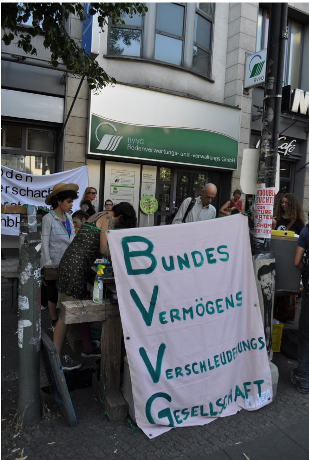
Protest des Bündnis Junge Landwirtschaft vor der Berliner Zentrale der BVVG, Berlin, 2013

Bezüglich der BVVG-Privatisierungspolitik unterscheiden sich die Forderungen der Verbände, obwohl ihnen die Kritik an der ungerechten Verteilungswirkung gemeinsam ist. So fordern die AbL und das BjL ein Moratorium der Privatisierung, um die letzten Flächen in BVVG-Hand in einen Bodenfonds zu überführen, aus dessen Pool die Flächen an die bisher benachteiligten Betriebe wie Nebenerwerbslandwirt_innen, kleinere landwirtschaftliche und ökologische Betriebe sowie Existenzgründer_innen verteilt werden (Interviews, Vertreter AbL, BjL, beide März-April 2014). Der Bauernbund fordert hingegen den Stopp der Direktverkäufe und stattdessen ausschließlich öffentliche Ausschreibungen, bei denen die Losgröße auf maximal zehn Hektar verringert wird und an denen nur ortsansässige Landwirt_innen teilnehmen können. Hierdurch erhofft er sich einen besseren Zugang für kleinere und mittelgroße