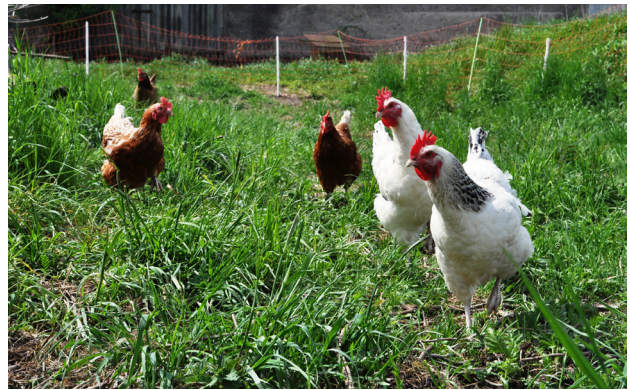
Bauernhof Erz, Rathstock, 2015

Zu nennen sind die Privatisierungs- und Subventionspolitik auf verschiedenen Ebenen. Hierdurch werden Anreize für Investoren geschaffen, in Land und Landwirtschaft zu investieren. Gleichzeitig findet dabei eine Umverteilung statt: öffentliche Steuergelder kommen großen landwirtschaftlichen Betrieben und Investoren zugute, kleine landwirtschaftliche Betriebe haben dadurch Nachteile und verlieren Land. Ein weiterer Aspekt ist Spekulation. Einige der Investoren setzen auf steigende Landpreise, um Profite zu „erwirtschaften“. Agrarland wird durch die Privatisierung für die Kapitalakkumulation zugänglich und durch den Verkauf ganzer Unternehmen in Form eines Share Deals leichter handelbar. Auch die Gründung von Aktiengesellschaften oder die Beteiligung von Investoren an kleineren Unternehmen, um diese beim Landkauf zu „unterstützen“, sind Beispiele hierfür. Daran zeigt sich auch, dass diese Prozesse eigene Krisen hervorbringen, die wiederum Profitmöglichkeiten für Investoren und Banken schaffen. Kleinere und größere landwirtschaftliche