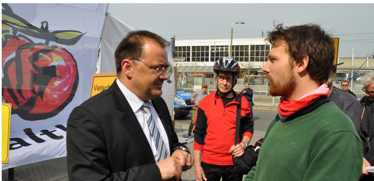
Brandenburgs Agrarminister Vogelsänger im Gespräch mit einem Junglandwirt, Demo anlässlich der Bundes-Agrarministerkonferenz 2014 in Cottbus

landwirtschaftliche Betriebe zu den Flächen (tel. Interview, Vertreter Bauernbund Brandenburg, 5.4.2014). Inzwischen hat der Bauernbund seine Position etwas verändert und fordert „faire Ausschreibungen unter ausschließlicher Beteiligung von ortsansässigen Landwirten“ (Bauernbund Brandenburg o.J.).