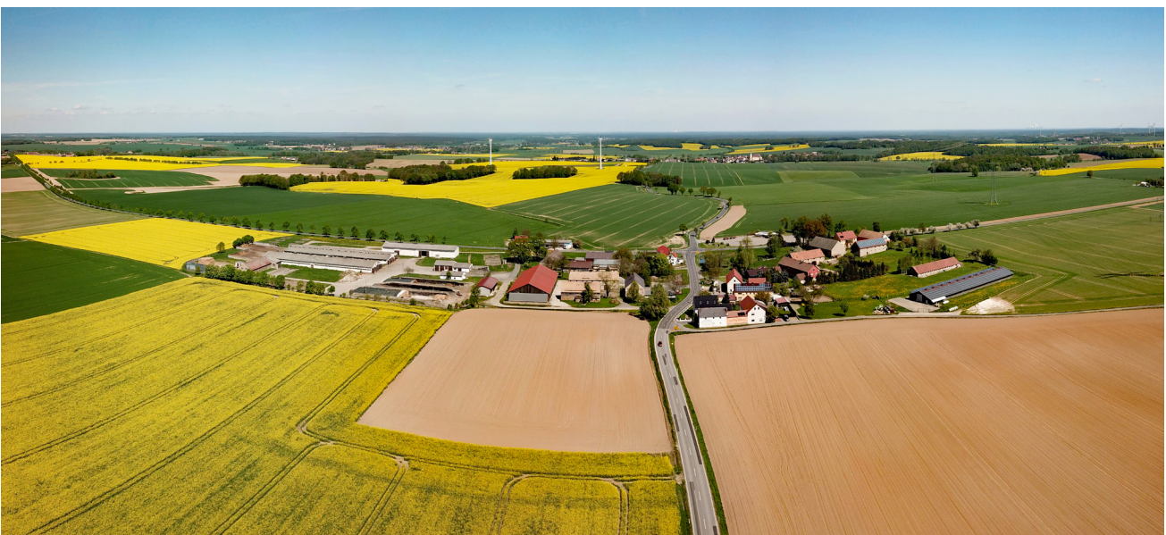
Rapsfelder in Panschwitz-Kuckau, Sachsen

Regel nach der Übernahme die Umstrukturierung der Leitungsebene im übernommenen Betrieb. Sie tauschen häufig das Führungspersonal aus, verschlanken die Führungsebene und bauen hierarchische Strukturen auf. Die effizientere bzw. gewinnorientiertere Strategie der Investoren zeigt sich auch in der Produktionsausrichtung der Betriebe. Sie stellen oftmals auf reinen Ackerbau sowie Biogaserzeugung um oder setzen auf große Massentierhaltung. Hierbei bauen sie insbesondere flex crops wie Mais, Raps und Weizen an (Akram-Lodhi et al. 2009). Hieran zeigt sich, dass land grabbing nicht mit der Aneignung von Land endet. Vielmehr findet eine Umgestaltung der landwirtschaftlichen Betriebe und deren Produktion nach profitorientierten Kriterien statt. Das Handeln von Investoren zeichnet sich darüber hinaus durch einen spekulativen Ansatz aus. Häufig spekulieren sie auf die Steigerung der Bodenpreise. Dies gilt insbesondere für AgroEnergy als Private-Equity-Fonds , dessen Geschäftsmodell der Wiederverkauf der Betriebe zu einem späteren Zeitpunkt zu einem höheren Preis darstellt.