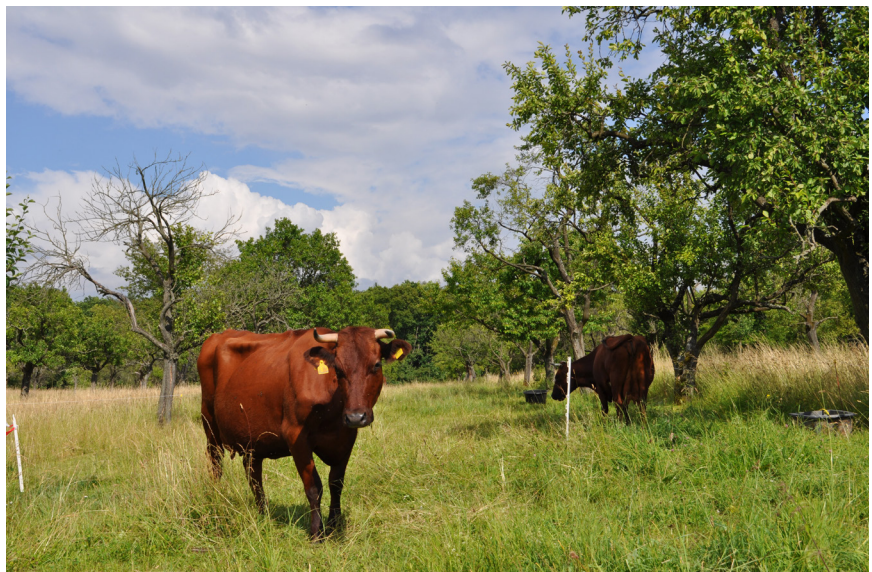
Betrieb Tonndorfer Schlossmilch, Schloss Tonndorf, 2014

weiterhin zu pachten oder kaufen. Um diesen Kapitalbedarf zu decken, nehmen Landwirte Kredite auf, welche Banken aktuell in Folge der Finanzkrise zu günstigen Konditionen an diese vergeben. Diese Kredite für Investitionen in Boden erhöhen dabei den Kredit- bzw. Schuldenanteil