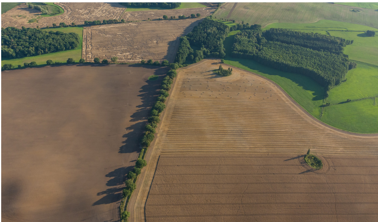
Großflächige Felder in der Nähe von Waren (Mecklenburg-Vorpommern)

Im Zuge der Transformation des Agrarsektors gestaltete sich die Interessenvertretung der Bäuerinnen und Bauern um. So nahm der Deutsche Bauernverband (DBV) Westdeutschlands nach anfänglicher Skepsis die SED-nahe berufsständische Interessenvertretung VdgB auf, um sein Repräsentationsmonopol der Bäuerinnen und Bauern gegenüber der Politik auf Bundes- und EU-Ebene zu erhalten. Hierfür stellte der DBV das Leitbild des bäuerlichen Familienbetriebes zurück und erkannte „die LPG-Nachfolger als legitime Mitglieder der Agrarfamilie“ (Land 2000: 212) an; die ehemaligen Vorstände der LPG-Betriebe (sogenannte „Agrarkader“) konnten sich so politischen Einfluss auch über die Wende hinweg sichern. Die Verbände der Wiedereinrichter_innen, eher bäuerlichen Landwirtschaft, waren und sind hingegen zersplittert und stehen in der politischen Opposition zum DBV (Gerke 2010: 92ff; Land 2000: 212).