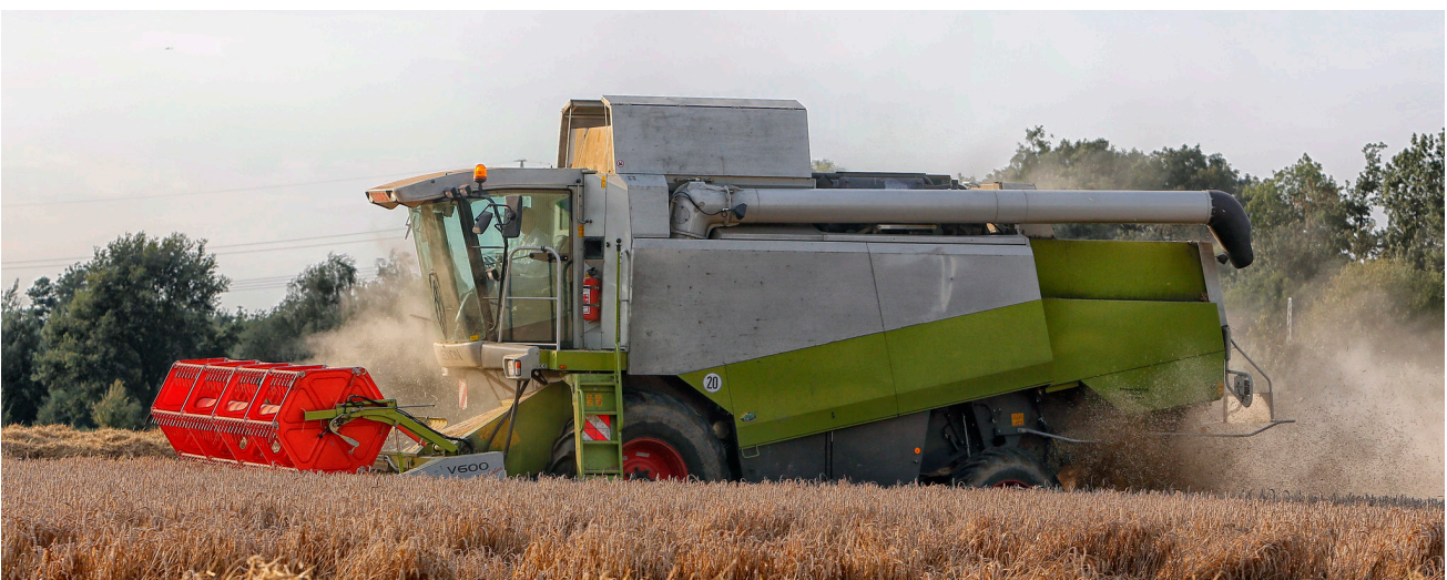
Industrialisierte Landwirtschaft: Mähdrescher bei der Weizenernte

Land grabbing wirkt sich auch auf Arbeitsverhältnisse und Beschäftigung in der Landwirtschaft aus. In der Regel werden von Investoren in übernommenen Betrieben Arbeitsplätze abgebaut: arbeitsintensive Betriebszweige wie die Tierhaltung werden abgeschafft und verschiedene Arbeitsprozesse ausgelagert. Häufiger und in größerem Umfang als lokale Betriebe engagieren die Investoren sogenannte Lohnunternehmen, die landwirtschaftliche Dienstleistungen anbieten und die Arbeit von vorher angestellten Arbeitskräften übernehmen. Arbeit wird somit outgesourct. Investorenbetriebe setzen Arbeitskräfte effizienter, überbetrieblich und überregionaler ein. Insgesamt lässt sich daher ein deutlich geringerer Arbeitsbesatz bei den Investoren feststellen (Schumann 2013a; Keller 2014; Interview, Vertreter BjL, Berlin; 28.3.2014).