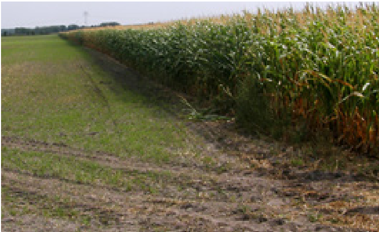
Oderbruch, 2009