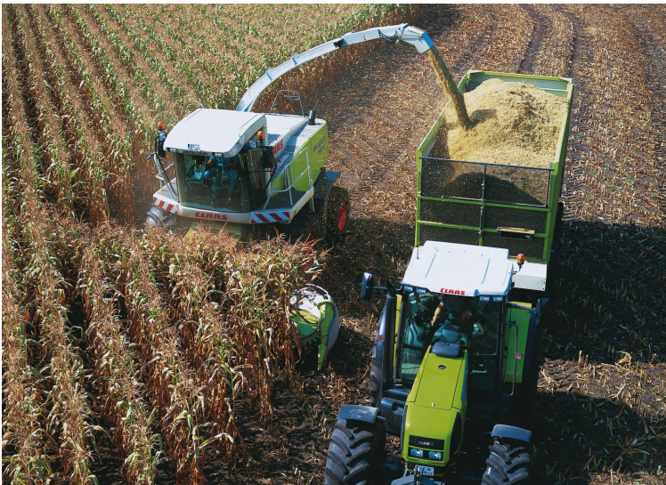
Industrialisierte Landwirtschaft: Feldhäcksler bei der Maisernte

kapitalstärker sind und bei ihrer aktiven Suche nach Land „Kampfpreise“ ausrufen (tel. Interviews, Vertreter AbL, Bauernbund Brandenburg, beide April 2014). Dies können sie auch, weil sie häufig Biogasanlagen betreiben, wodurch ihre Gewinnmargen höher sind und sie entsprechend höhere Pachtpreise als Landwirt_innen zahlen können (Brendel 2011: 5). Die gewachsene Nachfrage nach Land beschränkt sich allerdings nicht nur auf die externen Investoren. Auch