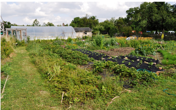
Kleinbäuerliche Landwirtschaft: Betrieb Tonndorfer Schlossmilch, Schloss Tonndorf, 2014

Eine Bewertung der Auswirkungen von land grabbing in Ostdeutschland muss allerdings auch berücksichtigen, dass die bestehenden landwirtschaftlichen Betriebe bereits nach kapitalistischen Prinzipien funktionieren. Dennoch verstärkt sich die kapitalistische Logik innerhalb der landwirtschaftlichen Investoren-Betriebe: Interessen von Anleger_innen oder Aktionär_innen werden wichtiger, bäuerliche Werte wie die Bindung an die eigene Scholle – das eigene Stück Land – oder das Denken in Generationen weichen ausschließlich betriebswirtschaftlichen Entscheidungen von Controller_innen. Management-Konzepte wie Lean Production – beispielsweise durch die Verschlinkung der Betriebsstrukturen – dominieren den Betriebsaufbau, die Konzentration von Land und Verfügbarkeit von Kapital ermöglicht einen Ausbau der Agrarindustrialisierung und die stärkere Einbindung in nachgelagerte Märkte. Zudem weitete sich der Landmarkt aus: Share Deals erleichtern den Handel mit Land, Privatisierungen macht öffentliches Land handelbar. Daran wird auch deutlich, dass land grabbing nicht bei der Aneignung von Land endet, sondern damit