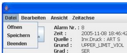
Abbildung 2: Maskenausschnitt: Menü Datei