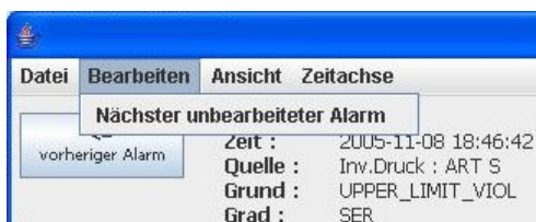
Abbildung 6: Maskenausschnitt: Menü Bearbeiten

Die Alarmbewertungen werden zur Speicherung vom Programm intern kodiert. Diese Kodierungen können den einzelnen Auswahlmöglichkeiten eindeutig zugeordnet werden. Eine mit der Eingabemaske abgespeicherte Datei kann von dieser ebenso wieder geöffnet werden, wie eine gewöhnliche nicht annotierte Alarmdatei. So ist es möglich eine teilweise bewertete Alarmdatei zu einem späteren Zeitpunkt zu ergänzen und zu vervollständigen. Über das Menü Bearbeiten → Nächster unbearbeiteter Alarm (Abbildung 6) kann sofort zum nächsten noch zu annotierenden Alarm gesprungen werden ohne dass dieser mit der Schaltfläche nächster Alarm gesucht werden muss.