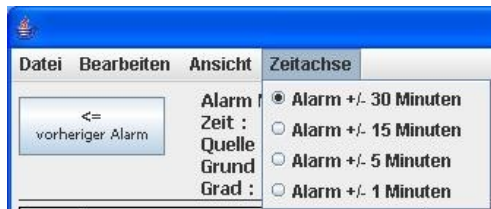
Abbildung 4: Maskenausschnitt: Menü Zeitachse