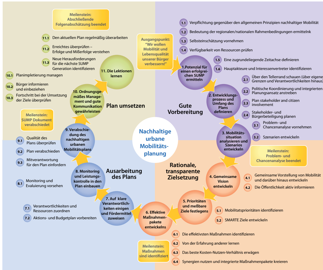
Abbildung 2: Strategic Urban Mobility Plans (SUMP)