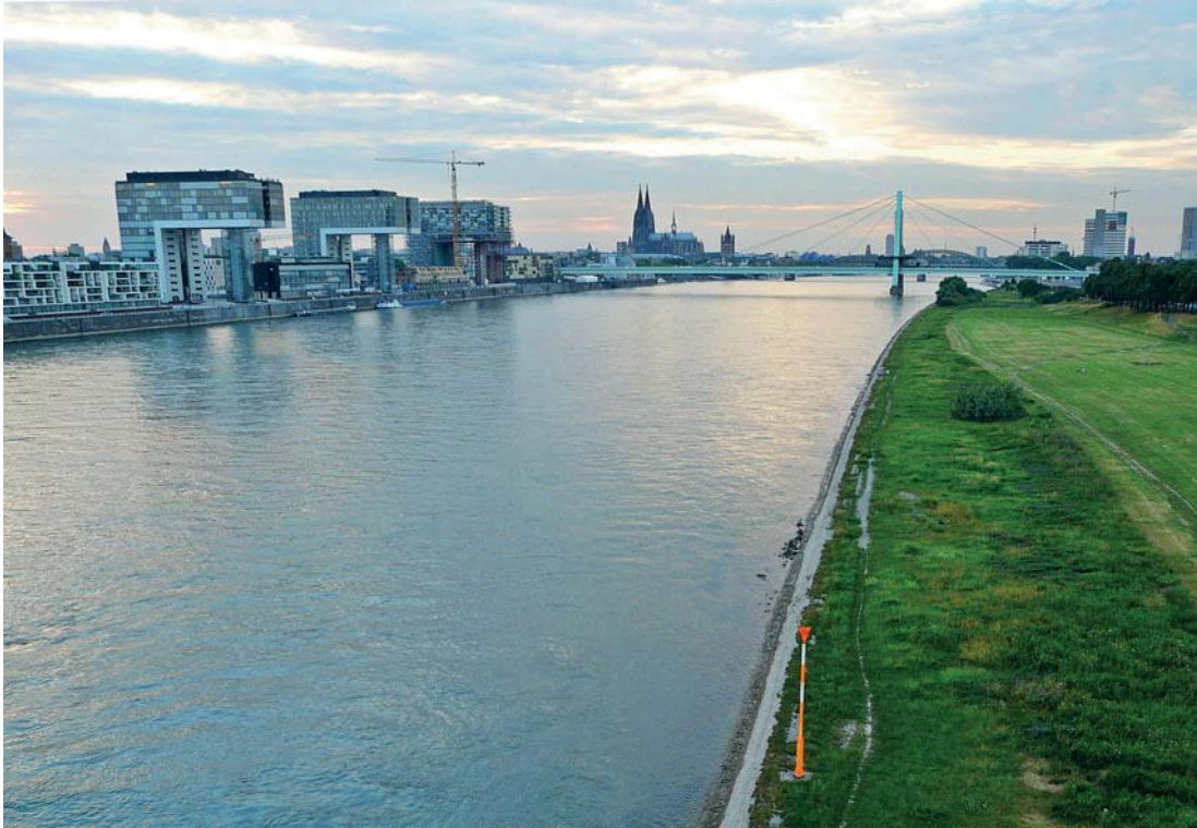
Abbildung 2: Der Kölner Rheinauhafen – neues, multifunktionales Quartier am Wasser