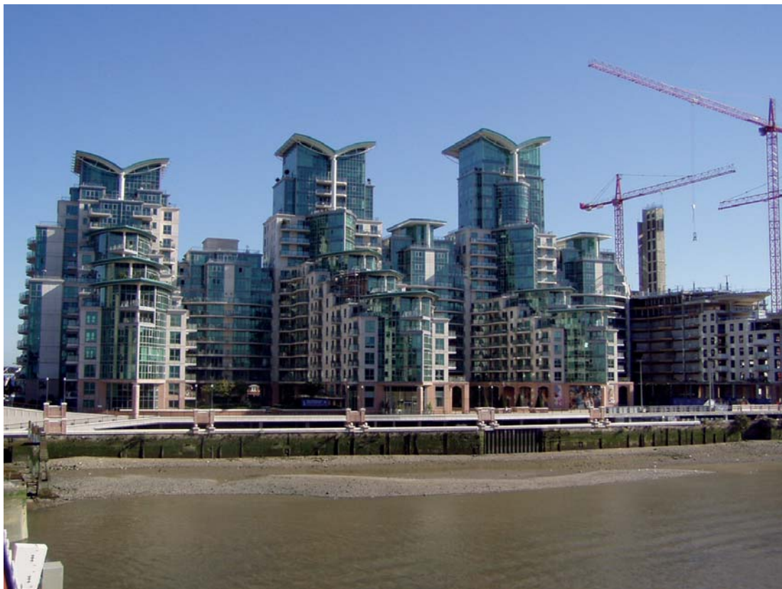
Abbildung 3: Luxusapartments (St. Georges Wharf) am Themse-Ufer in West-London

Ein noch differenzierteres Bild der Stadtstruktur hat Krätke (1995) entworfen, dessen Modell der „quartered city“ von einer feineren Ausdifferenzierung der sozialräumlichen Strukturen ausgeht. Krätke betrachtet die Städte als einen sozio-ökonomischen Flickenteppich aus Armutinseln und Luxusquartieren. An die Innenstadt, die durch Büros, Shopping-Center, Urban Entertainment Center etc. geprägt ist, schließt sich die gentrifizierte Wohnstadt an. In deren aufgewerteten Altbauquartieren wie auch in modernen Apartmentkomplexen bzw. Villenvierteln residieren die jungen urbanen Eliten, die in den Unternehmen der gehobenen Dienstleistungsökonomie beschäftigt sind (▷ Gentrifizierung ) (s. Abb. 3). Des Weiteren gliedert Krätke die Wohngebiete des Mittelstandes, der niedrig entlohnten Arbeiterbevölkerung und der verarmten Bevölkerung aus.