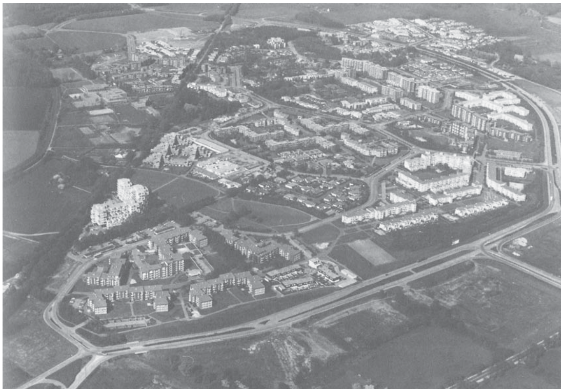
Abbildung 2: Neue Stadt Wulfen (Hauptbauzeit 1962–1977)

In den ersten Jahrzehnten nach dem Zweiten Weltkrieg war die Stadtentwicklung durch umfangreiche Stadterweiterungen und Baulandausweisungen geprägt. Die Städte wurden nach dem Leitbild der gegliederten und aufgelockerten Stadt (Zeitraum 1950–1965; vgl. Göderitz/Rainer/Hoffmann 1957) und dem Leitbild Urbanität durch Dichte erweitert (Zeitraum 1960–1975; vgl. Simon 2001). Vielfach entstanden Neubaugebiete als Großsiedlungen mit mehr als 1.000 Wohneinheiten und Trabantenstädte zur Entlastung der bestehenden Städte sowie Einfamilienhausgebiete am Rand der Städte. Es gab Planungen für ganz neue Städte; in England ist Milton Keynes eine der bekanntesten New Towns mit heute rund 250.000 Einwohnern. In Deutschland entstanden z. B. die Sennestadt nach dem Entwurf von Hans Bernhard Reichow (ab 1954) oder die Neue Stadt Wulfen (1962–1977), Projekte, die jedoch nicht zu Ende geführt wurden.