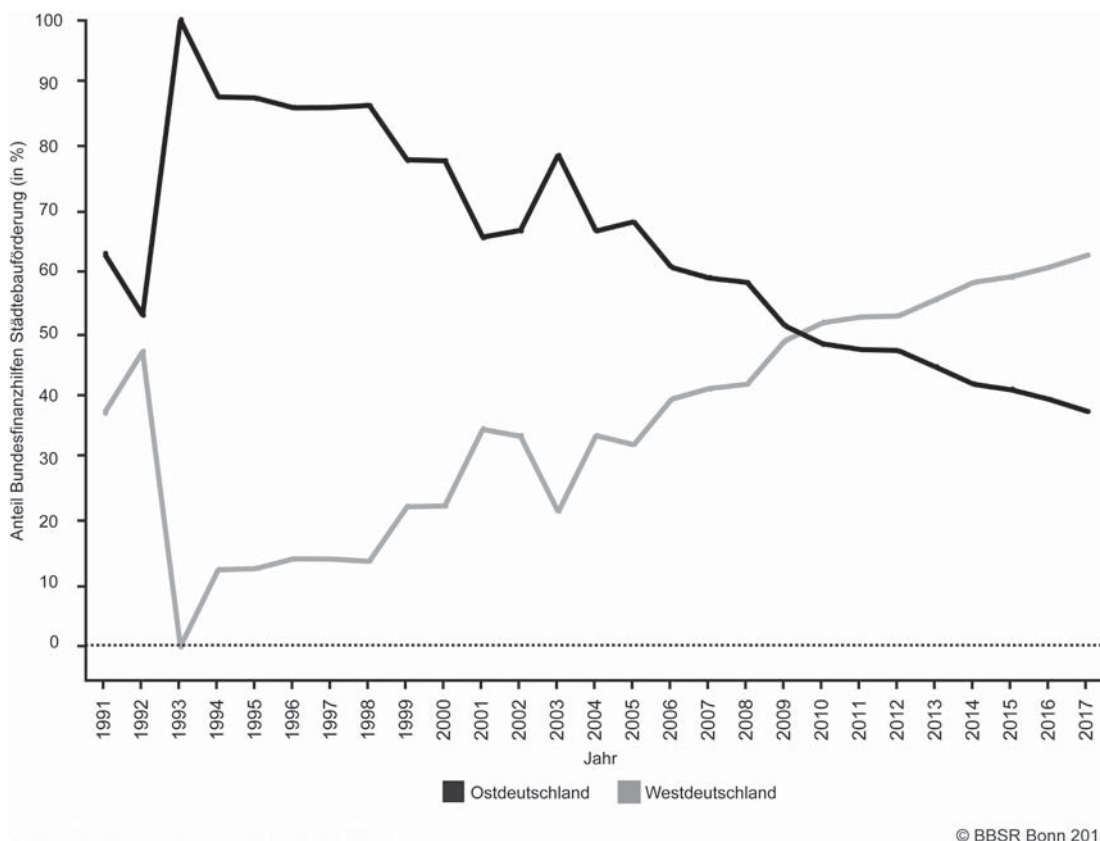
Abbildung 2: Anteil der ost- und westdeutschen Länder am Gesamtvolumen der Städtebauförderung 1991 bis 2014