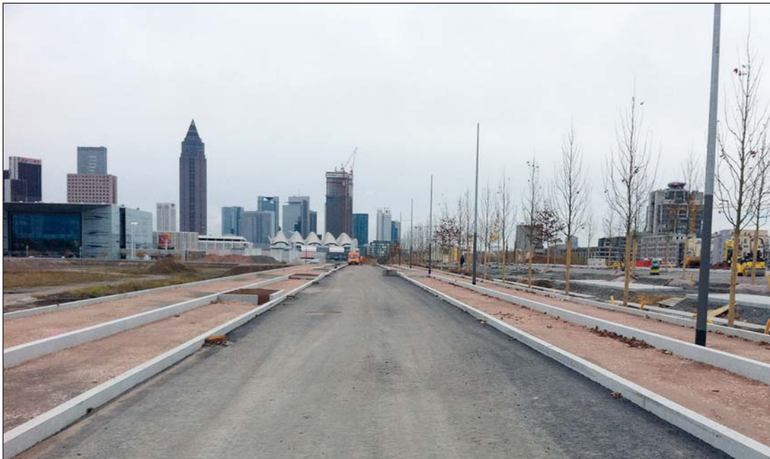
Abbildung 1: Finanzierung von Erschließung, sozialen Infrastrukturen und Freiraumgestaltung im Europaviertel Frankfurt am Main mittels Beiträgen der Grundstückseigentümer gemäß Vereinbarungen der städtebaulichen Verträge

Ein anderes Beispiel ist Frankfurt am Main, wo mittels maßgeschneiderter städtebaulicher Verträge mit den Grundstückseigentümern die Umnutzung des ehemaligen Rangier- und Güterbahnhofs im Frankfurter Westen zu einem neuen Stadtteil mit über dreißigtausend Einwohnern und Beschäftigten sowie der Erweiterung des innerstädtischen Messegeländes entstehen wird. Planung, Gestaltung und frühzeitiges Realisieren der Erschließung, von sozialen Infrastrukturen wie Kindergarten und Primarschulen sowie das Bereitstellen hochwertig gestalteter öffentlicher Freiräume hat wesentlich zur Adressbildung beigetragen und die Vermarktung der Grundstücke stimuliert (Scholl 2005; s. Abb. 1).