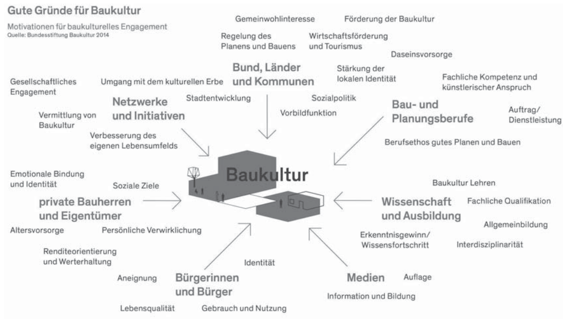
Abbildung 1: Gute Gründe für Baukultur