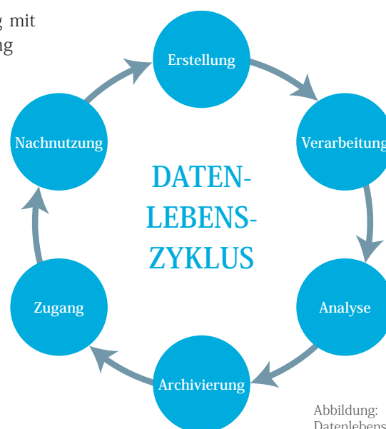
Abbildung: Datenlebenszyklus