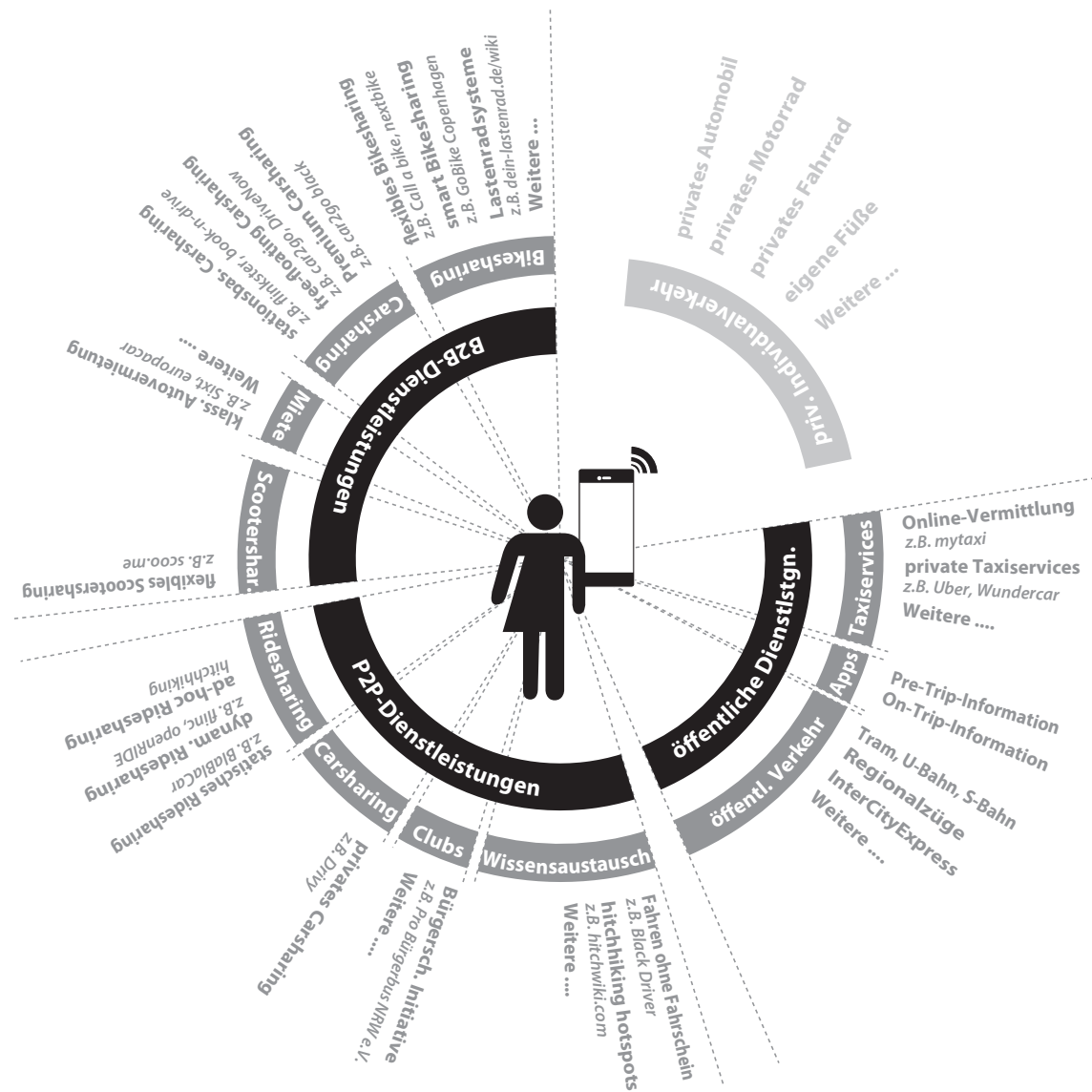
Abbildung 1: Multioptionalität im Internet der Mobilitätsdienstleistungen